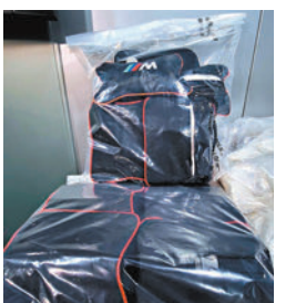
◆毒販利用物流運輸將一批藏有可卡因的墊褥偷運入境。

香港文匯報訊（記者 蕭景源）有毒販將毒品暗藏在一批墊褥中，利用香港物流運輸入境企圖瞞天過海。警方根據情報，於本周二突擊搜查元朗一個物流倉庫，在一批入口的墊褥中起出28公斤懷疑可卡因，總值3,500萬元，拘捕一名到倉庫提貨的男子。