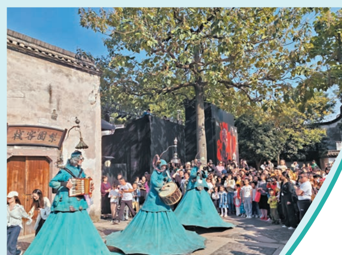
◆烏鎮戲劇節的街頭演出。

無論是《「數位系列」13/14》《沉沒之城》等舞劇，還是《暴風雨》、《培爾·金特》、《終局》等經典劇作，或是《洞》、《帶小狗的女人》等校園作品，烏鎮戲劇節對多元文化的尊重和接納，為藝術創作和交流提供了一個寬廣的舞台，不同類型的戲劇都可以在這裏找到自己的聲音。