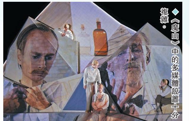
◆《廬山》中的多媒體設置十分複雜。