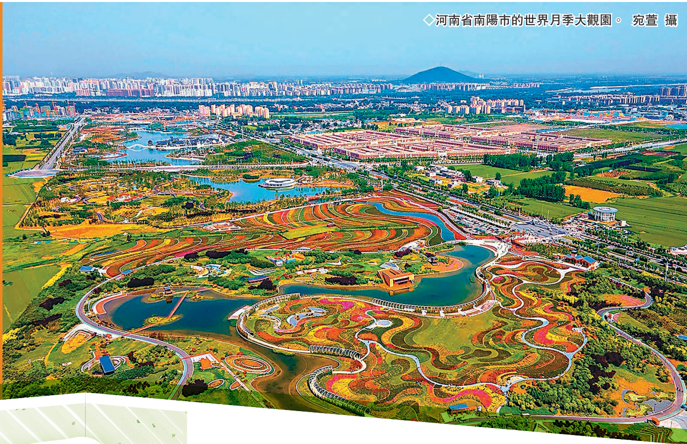
◆河南省南陽市的世界月季大觀園。