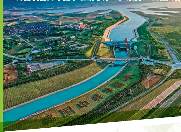
◆河南省南陽市南水北調中線工程渠首。