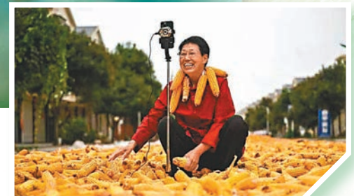
◆南陽市內鄉縣王店鎮農民網上直播賣豐收的玉米。

等五大特色產業，發展花卉苗木58萬畝、中藥材190萬畝、優質水果58.5萬畝、食用菌5.1億袋、茶葉24.5萬畝；以牧原集團、想念麵業等為龍頭的八大產業集群77家重點企業銷售總收入達1,344.88億元人民幣、增長45.3%，30個省級農業產業化聯合體銷售總收入達1,494.75億元人民幣，增長10.1%；新創建四個國家級農業產業強鎮，四個國家級優勢特色產業集群，18個國家級「一村一品」示範村鎮。