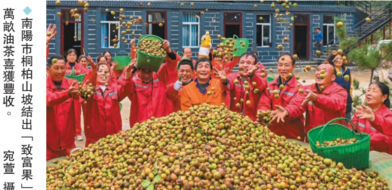
◆南陽市桐柏山坡結出「致富果」萬畝油茶喜獲豐收。

金風送爽，玉米飄香，南陽的廣大農村，村民們利用晴好天氣，晾晒收穫的秋作物，構成一幅幅美麗的「曬秋圖」。