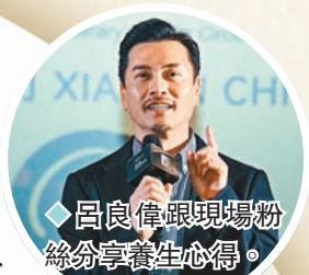
◆呂良偉跟現場粉絲分享養生心得。

香港文匯報訊（記者 阿祖）陳嘉上監製、李保樟導演，鄧麗欣、劉以豪、呂良偉（呂哥）及李靖筠主演的愛情懸疑新片《白晝如焚》繼早前晉身倫敦東亞電影節後，一個月內二度入圍大型影展，前晚呂良偉以一身貴氣西裝造型登場，代表劇組參與金雞百花電影節，與現場過百傳媒見面。電影更獲頒「年度期待華語電影」獎項，在來年上映前再獲殊榮，肯定了電影的實力。呂哥領獎時笑逐顏開，答謝大會予以肯定，同場更有圈中友好吳京、周冬雨、導演劉偉恆、導演卓亦謙等出席，氣氛相當熱鬧，一眾影迷更打成一片，互相祝賀。