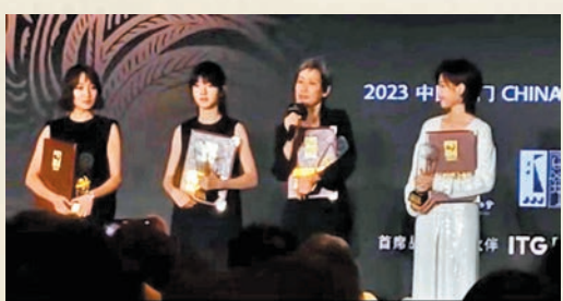
◆獲提名金雞獎最佳女配角的葉童(右二)在台上致辭。

作為提名領跑者，由烏爾善執導、在今年暑期掀起全民討論熱潮的《封神第一部：朝歌風雲》，收穫最佳故事片、最佳編劇、最佳導演、最佳男配角（李雪健）、最佳女主角（袁泉）、最佳攝影、最佳錄音、最佳美術、最佳剪輯共9項提名。