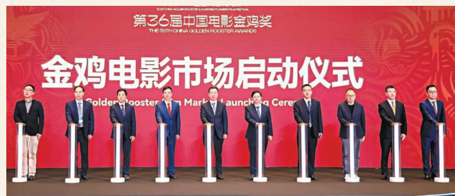
◆金雞電影市場啟動儀式昨日舉行。

今年是金雞電影節在廈門舉辦第五年，廈門首次增設「金雞電影市場」單元，邀請來自香港、台灣等地區和內地主流影視機構舉辦金雞華語電影巡禮、華語電影推介會、各廠牌電影項目推介活動和單片發布會等10場主題活動，同步進行市場放映和展示交流，切實打造華語電影一站式交流交易平臺。另外，香港文化體育及旅遊局局長楊潤雄，亦在電影節期間開啟在廈門訪問行程。楊潤雄在與中國電影家協會黨組書記張宏、國家電影局副局長白軼民等內地官員介紹了今年香港特區政府施政報告提出的「開拓內地電影市場資助計劃」。據悉，該計劃旨在為香港導演提供更多機會，培養他們對內地市場的掌握，豐富其視野和經驗，加強兩地交流，令香港導演人才能夠製作更優秀作品，並將作品帶給廣大內地觀眾。