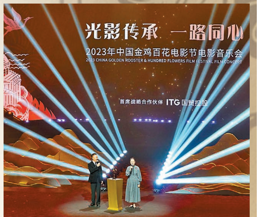
◆內地演員侯勇和奚美娟點亮金雞。