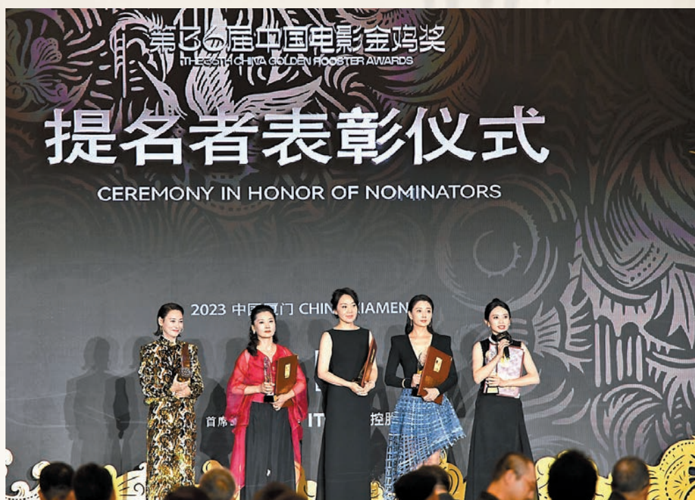
◆左起：惠英紅、何賽飛、閔妮、殷桃、黃堯昨日出席中國電影金雞獎提名表彰儀式。

香港文匯報訊（記者 蔣煌基 廈門報道）2023年中國金雞百花電影節電影音樂會及第36屆中國電影金雞獎提名表彰儀式11月3日在福建廈門舉行。在提名者表彰儀式上，港星梁朝偉、惠英紅、葉童三位首次獲得金雞獎提名及表彰，成本屆金雞獎提名名單中最耀眼明星。梁朝偉、惠英紅亦憑借最佳男主角、最佳女主角提名，有望在本屆金雞電影節上獲封帝后；值得一提的是，惠英紅曾拿下香港電影金像獎最佳女主角及台灣電影金馬獎最佳女主角獎項，若今次爭獎成功，她會成為第四位「三金影后」。