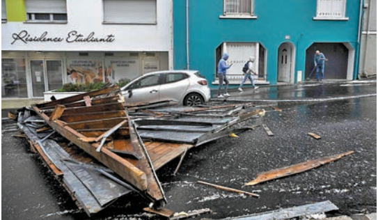
◆法國西部布雷斯市一間房屋的屋頂被強風吹翻,殘骸散落路上。

班航班。中國駐法大使館發出警告,提醒旅法中國公民注意防範風暴災害,密切關注天氣預報和時事新聞,及時了解並聽從當地政府應對建議,做好必要生活物資儲備,如有緊急情況應及時報警或聯繫消防部門。