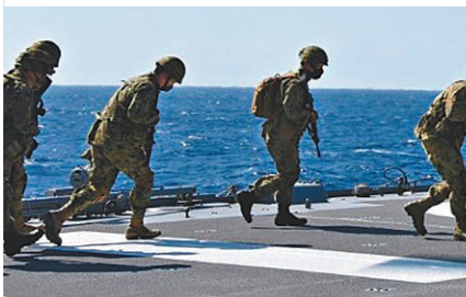
◆「戰斧」巡航導彈。網上圖片 ◆日圓貶值影響日國防採購。圖為自衛隊員登上艦隻上的運輸機。網上圖片

香港文匯報訊 日本於2022年12月正式通過新版《國家安全保障戰略》《國家防衛戰略》和《防衛力量整備計劃》(即「新安保三文件」),計劃未來5年投入破紀錄的3,200億美元(約2.49萬億港元)用於國防採購。然而路透社周五(11月3日)援引8名知情人士稱,日圓貶值正迫使日本縮減其防衛計劃。