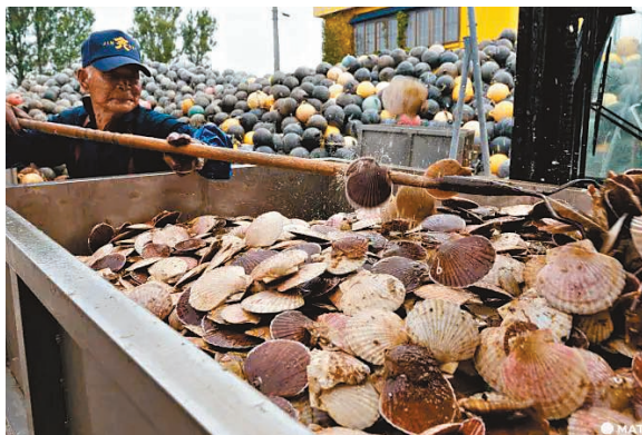
◆日本水產品因中國進口禁令滯銷,青森縣產的扇貝需轉內銷。

據東電稱,已向被認為有必要盡快支付賠償金的約210家企業發送索償文件,但實際支付的僅有幾家,正考慮在北海道和九州也設諮詢窗口。