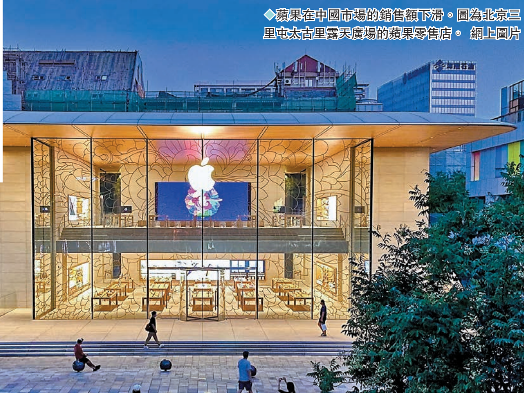
◆蘋果在中國市場的銷售額下滑。圖為北京三里屯太古里露天廣場的蘋果零售店。