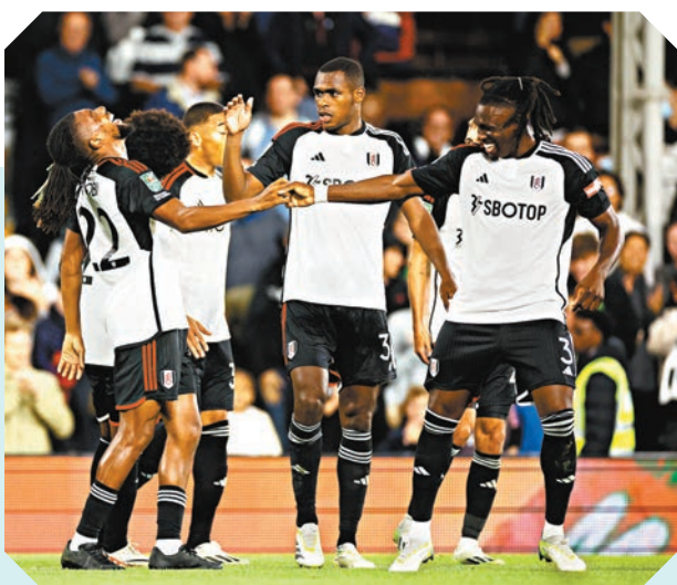
◆富咸希望藉曼聯內部不穩下搶分。