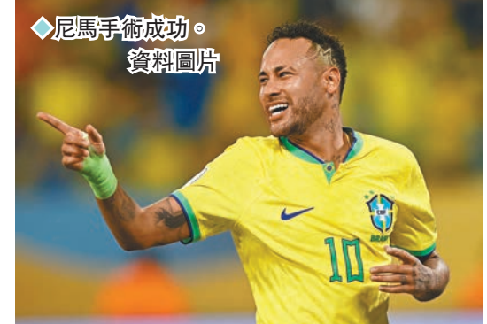
◆尼馬手術成功。資料圖片

在上月對烏拉圭世界盃外圍賽受重創的巴西球星尼馬，昨日順利完成十字韌帶和半月板手術；尼馬及後在個人社交平台報平安道：「手術順利，感謝各界的祝福，現在我會專心休養為復出作準備。」至於替尼馬負責手術的巴西隊隊醫拉斯馬，亦表示尼馬的手術十分成功。 ◆綜合外電