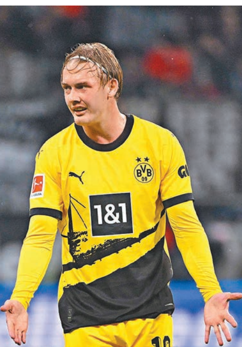
◆多蒙特今季對強隊的表現平平。

香港文匯報訊(記者 楊浩然)德甲在香港時間周日(5日)凌晨上演大戰，由「蜜蜂兵團」多蒙特主場對拜仁慕尼黑。拜仁雖然剛在過去周中盃賽不敵丙組球隊出局，但在有主力殺手哈利卡尼復任正選下，面對多蒙特還是可以看高一線。(now639台周日1:30a.m.直播) 拜仁在過去周中德國盃，意外作客以1:2不敵丙組球隊沙貝根出局；但如有看過比賽，拜仁在過程中其實創造出大量入球機會，只是不知為何往往未能把握，因此並不能因為這次失利，便認定拜仁球員狀態有問題。最重要的是，今夏加盟拜仁後，聯賽9場射入12球的主力殺手哈利卡尼，在過去周中獲輪換後今晚肯定復任正選，有這位英格蘭國腳在前場壓陣，拜仁便再不用擔心把握力的問題。 多蒙特今夏出售了主力比寧威子皇馬，但卻只購入沙比薩作替補下，於聯賽仍保持一定競