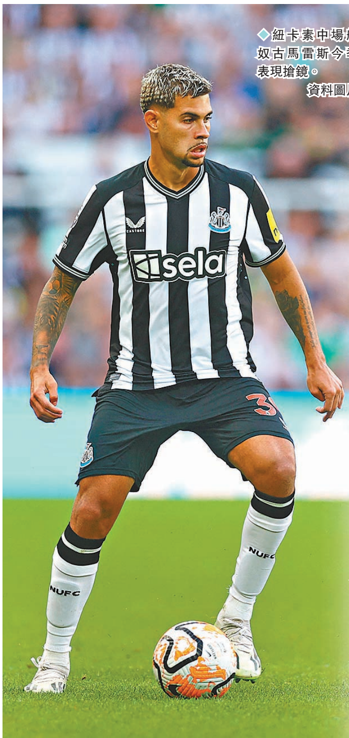
◆紐卡素中場般奴古馬雷斯今季表現搶鏡。資料圖片