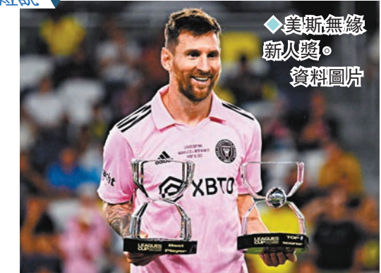
◆美斯無緣新入獎。資料圖片