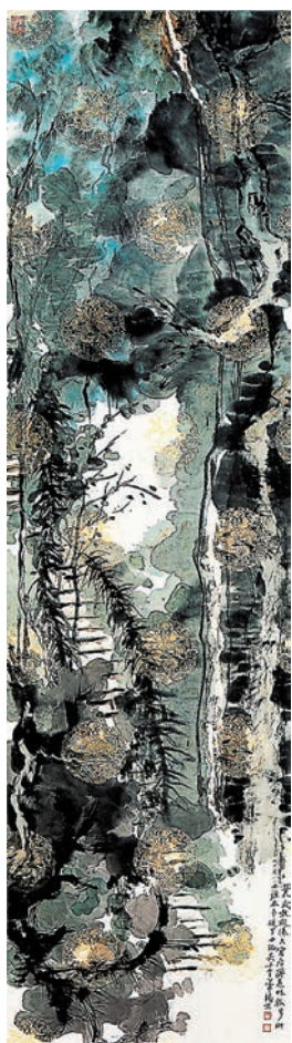
◆饒宗頤畫作《薄扶林雨中》