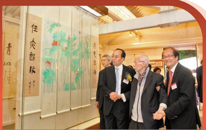
◆饒宗頤觀看陳列在饒宗頤文化館中的《荷花四屏》。