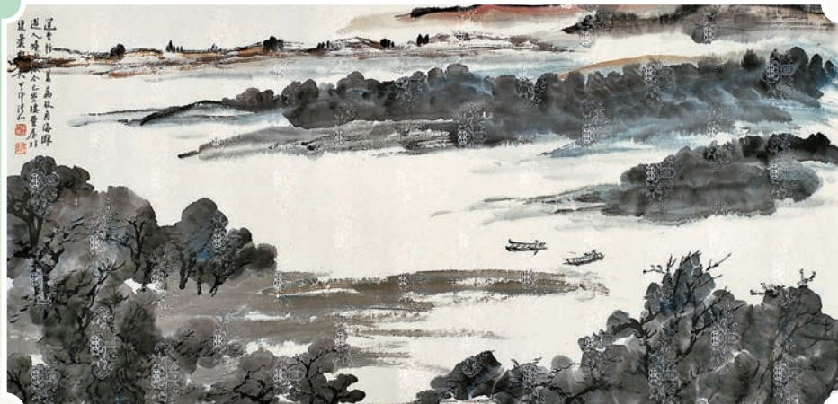
◆饒宗頤畫作《荔枝角海灘》