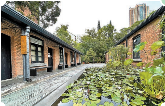
◆饒宗頤文化館中一方蓮池是饒公繪畫的靈感來源。