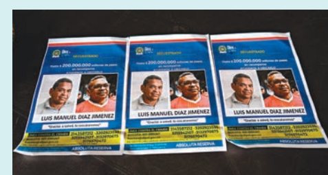
◆當局尋找戴亞斯爸爸下落的單張。

利物浦將作客盧頓，主帥高洛普表示不會強迫戴亞斯上陣，出場與否將交由球員本人決定。