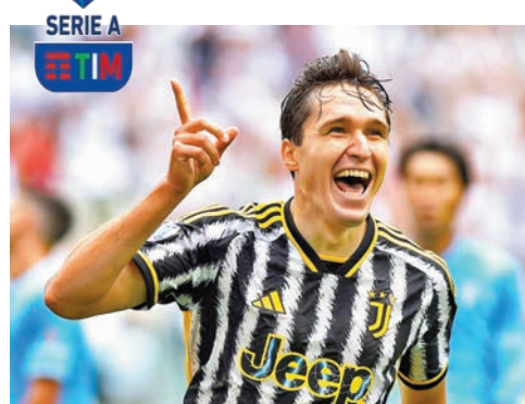
◆費達歷高基艾沙今季意甲9戰入4球。