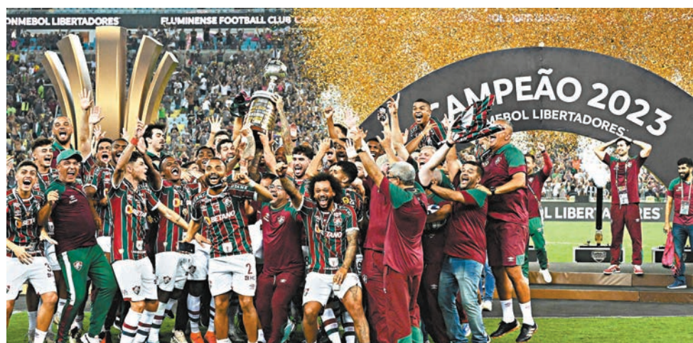
▲馬些路贏盡歐洲和南美頂級盃賽冠軍。