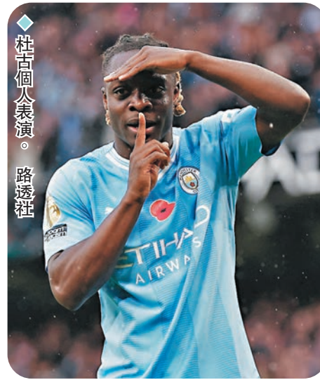
◆杜古個人表演。

經多重覆審雖判紐卡索入球有效，但整個過程主球證都沒有親自回看有關畫面。著名球評人李察基斯指出，最大問題是在於手球和犯規的嫌疑。阿仙奴領隊阿迪達賽後談到這個問題時也忿忿不平說：「這遠遠不足以形容這是世界上最好聯賽應有的(球證)水平，參與其中我感到很噁心。」他甚至直言這是一大「恥辱」。