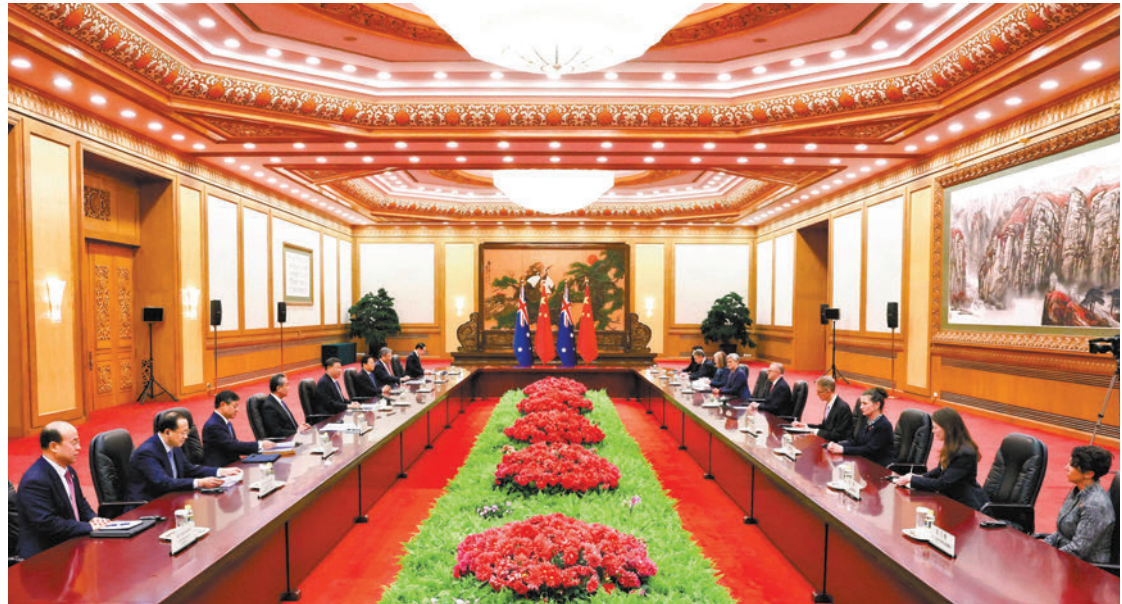
▲▶11月6日下午，國家主席習近平在北京人民大會堂會見來華進行正式訪問的澳大利亞總理阿爾巴尼斯。

香港文匯報訊 據新華社報道，11月6日下午，國家主席習近平在人民大會堂會見來華進行正式訪問的澳大利亞總理阿爾巴尼斯。習近平強調，中國在亞太地區不搞排他性小圈子，不搞集團政治，不搞陣營對抗。小圈子解決不了全球面臨的大挑戰，小集團適應不了當今世界的大變局。對那些把亞太地區搞亂的企圖，我們一是要警惕，二是要反對。