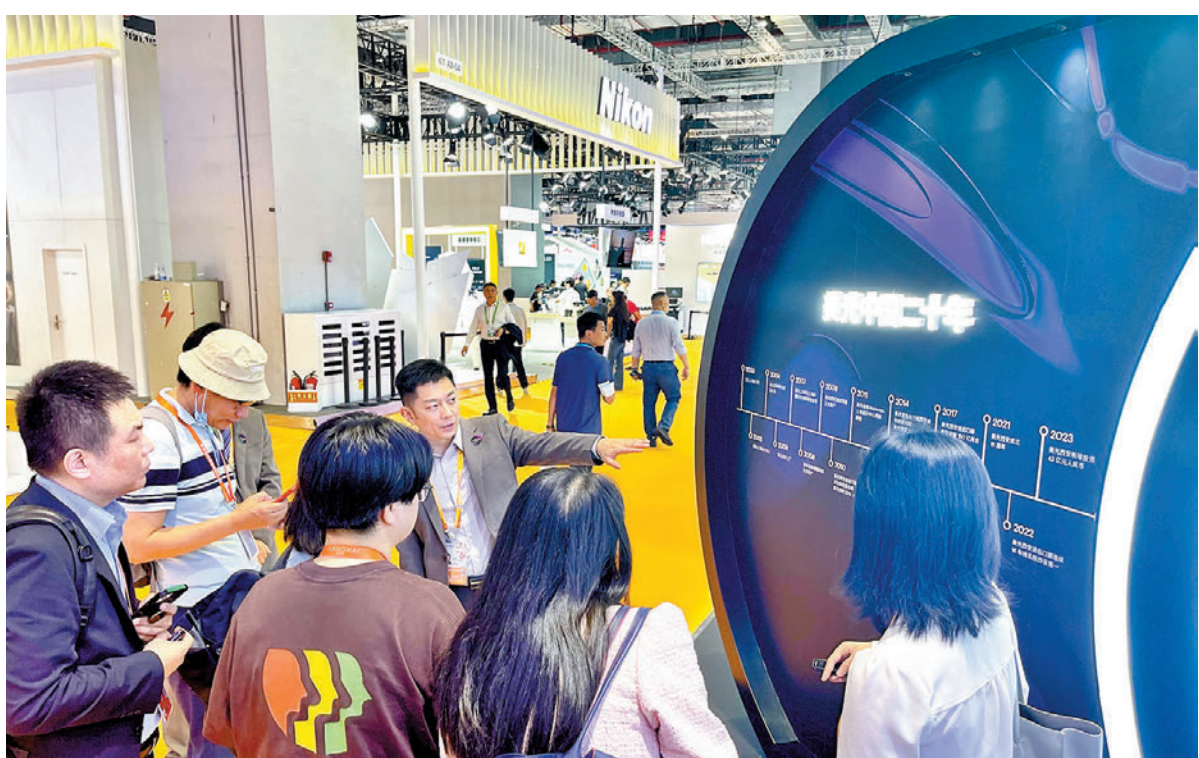
◆美國最大的存儲芯片製造商美光今年首次參加進博會，特設「數字中國」展示區，用行動表達對中國市場的重視。香港文匯報記者夏微 攝

另外，亞德諾、高通等知名企業也都在今年的進博會上帶來了前沿新品。例如高通還首次在國內展示基於最新旗艦驍龍移動平台、採用國內大模型在終端側運行的多個生成式AI用例等。