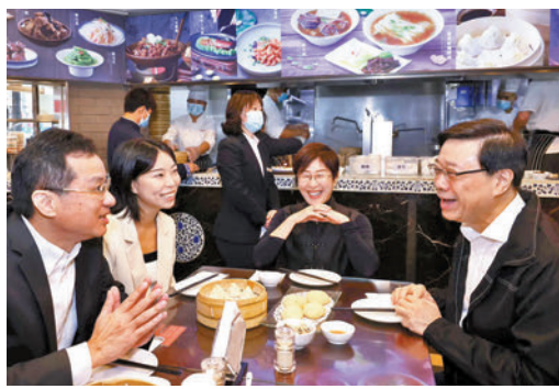
◆6日一早，李家超與同事在上海一家「百年老店」品嚐具有當地特色的早餐。李家超 Fb

在上海期間，李家超還收到了一份特別的禮物——由在滬港人團體贈送的、最新出版的《踔厲前行——在滬港人上海故事》一書。港區人大代表、滬港社團總會主席姚祖輝代表在滬港人向特首贈送了這份禮物，特首一拿到就翻開仔細閱讀，並給與充分肯定。據了解，為了記錄在滬港人的奮鬥歷程，也向更多港人介紹內地的發展，同時向「滬港合作會議機制」二十周年獻禮，在上海市有關部門及在滬港人社團的支持下，由大公文匯傳媒記者上海記者站記者對生活、工作在上海16個區的51位港人進行深度採訪，並由大公報出版有限公司結集出版。