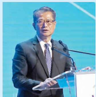
◆陳茂波表示，大灣區商機處處，香港已在人才和基建等方面作大量投資。

香港文匯報訊（記者 周紹基）香港經濟正穩步復甦，為了讓經濟提速，特區政府正積極引進更多企業投資和人才。特區政府財政司司長陳茂波昨在峰會預期，今年香港經濟增長將高於3%，增速較政府所希望的慢一點，但經濟復甦動力正在持續。未來10年將大力發展本地基建，也加大力度拓展與大灣區的運輸基建，呼籲在座金融領袖把握投資機會。