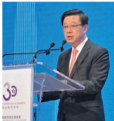
◆李家超昨在峰會致辭時表示，今年香港已處於世界舞台中心，為商業、金融和投資創造機會。

香港文匯報訊（記者 曾業俊）香港特區行政長官李家超昨在峰會致辭時表示，今日的世界比以往任何時候都更加複雜和具挑戰性，香港是自由開放的經濟體，很難不受全球經濟逆風影響；惟香港在「一國兩制」架構下，實施與全球許多主要金融中心一樣的普通法，是中國唯一的普通法司法管轄區，加上香港是內地與國際市場之間的門戶和全球資金流動的渠道，增強了香港作為國際金融中心的獨特優勢。