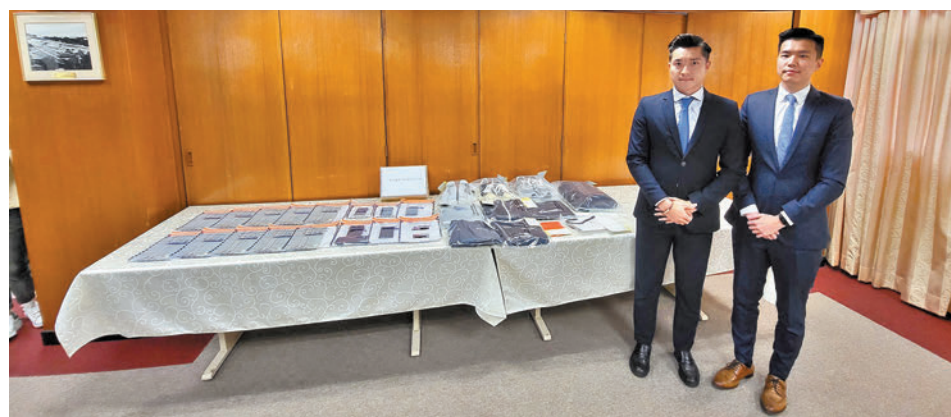
◆警方講述拘捕兩男涉三宗假扮兒子索「保釋金」騙案詳情及展示檢獲證物。

香港文匯報訊（記者 蕭景源）一名七旬老婦被騙徒假扮其兒子訛稱因打架被捕索要「保釋金」，先後6次致電共騙取其全部存款330萬元，在致電兒子求證後方知受騙上當。警方鎖定兩名男子跟蹤埋伏，於前日在荃灣一公廁以「以欺騙手段取得財產」罪拘捕兩名本地男子，揭發他們曾以同類手法騙取另外兩名長者約24萬元騙款。警方起回16萬元贓款，全部被捕者現正被扣留調查，不排除會有更多人被捕。