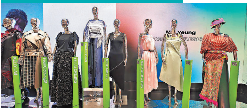
▲香港設計師時裝作品風格百花齊放。