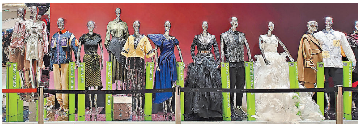
▲香港時裝成為曼谷購物中心內的風景線。