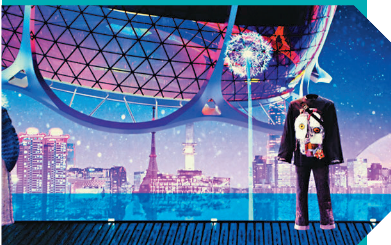
◆虛擬香港時裝出現在展場 LED 屏幕上。