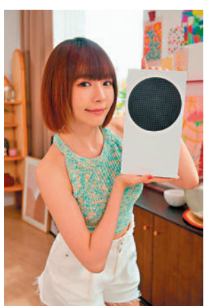
◆「明楨 BB」力推 Xbox 優惠。