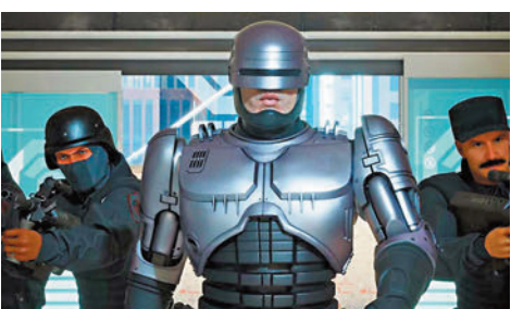
◆《鐵甲威龍》相隔多年再出新遊戲。