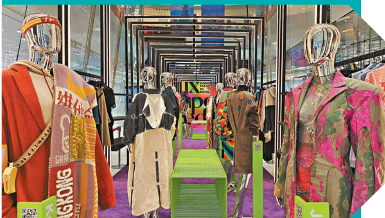
◆大家可於曼谷限定店購買香港設計師們的日常設計。