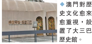
澳門對歷史文化愈來愈重視，設置了大三巴歷史館。