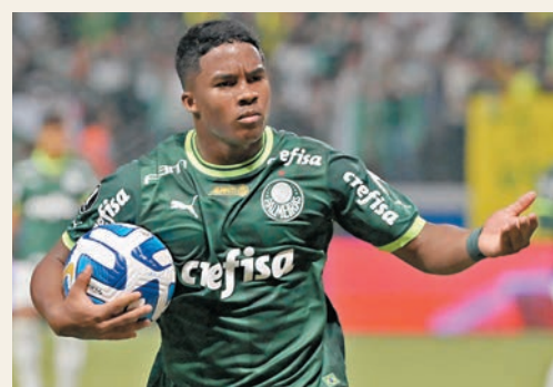
◆安歷克即將登陸西甲加盟皇馬。資料圖片