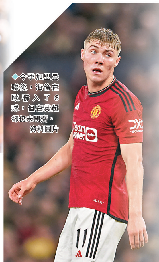
◆今季加盟曼聯後，海倫在歐聯入了3球，但在英超卻仍未開齋。資料圖片