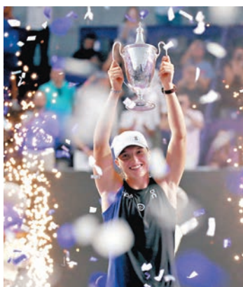
◆施禾迪贏得冠軍。

作，專注於正確的事情，最終也取得了成效。所以我真的非常開心。」施禾迪在本賽季收穫了WTA年終賽、法網、中網、斯圖加特公開賽、多哈公開賽、華沙公開賽共6項冠軍，全年戰績為68勝11負。