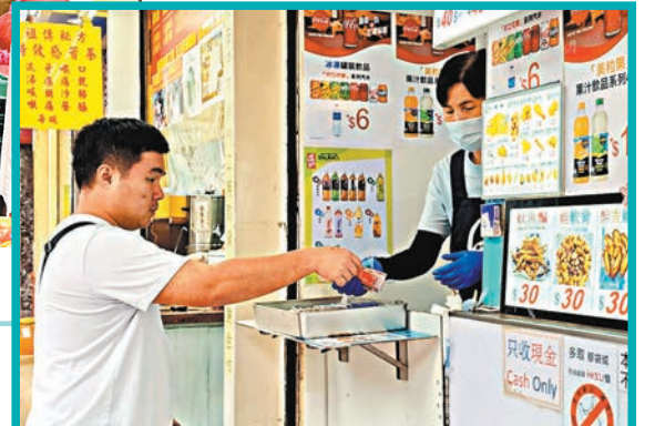
這店舖只收現金。

在特區政府派發電子消費券刺激下，過往甚少使用電子錢包的市民也開始「無現金化」的消費新常態。政府統計處數據顯示，2020年至去年期間電子流動支付的使用率明顯上升，惟大部分合資格市民於7月收到今年第二期2,000元消費券後，當中不少人已用光光，無現金化生活是否仍持續？