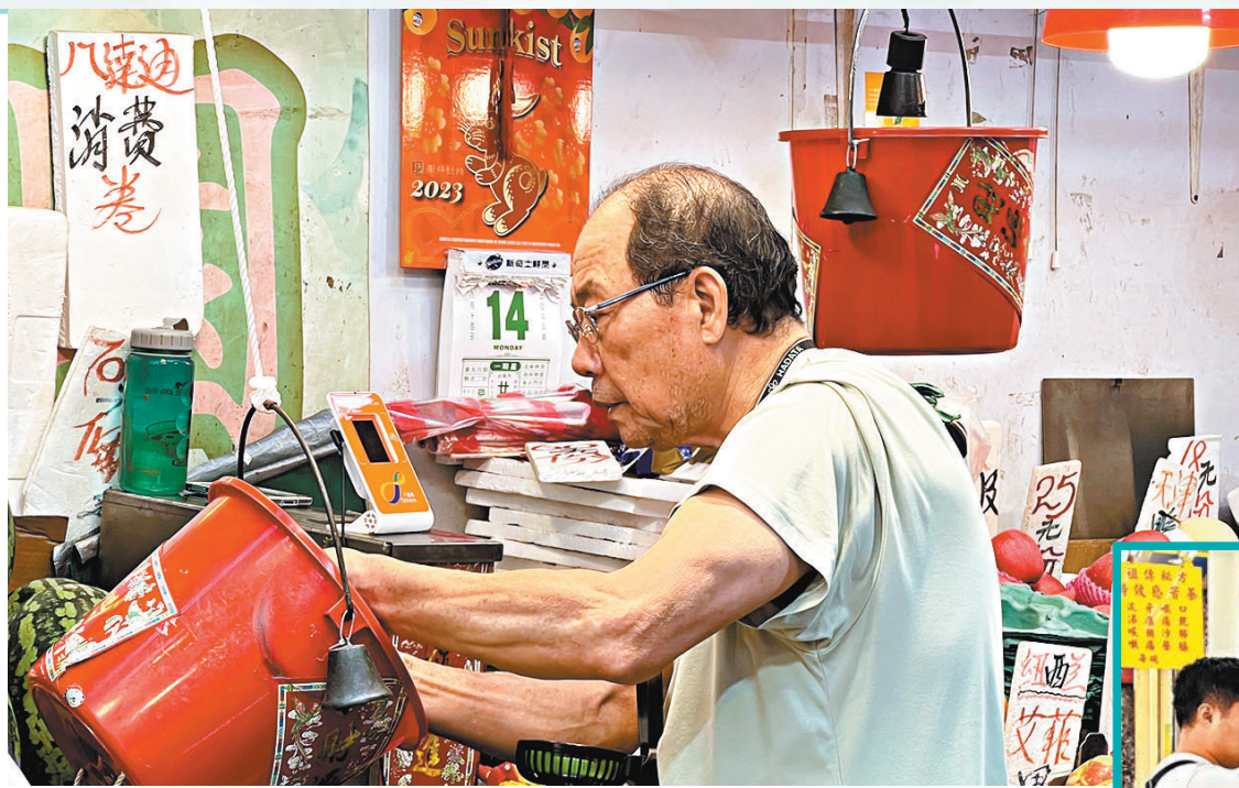
生果檔已裝電子支付工具，但光顧的市民仍傾向使用現金交易。