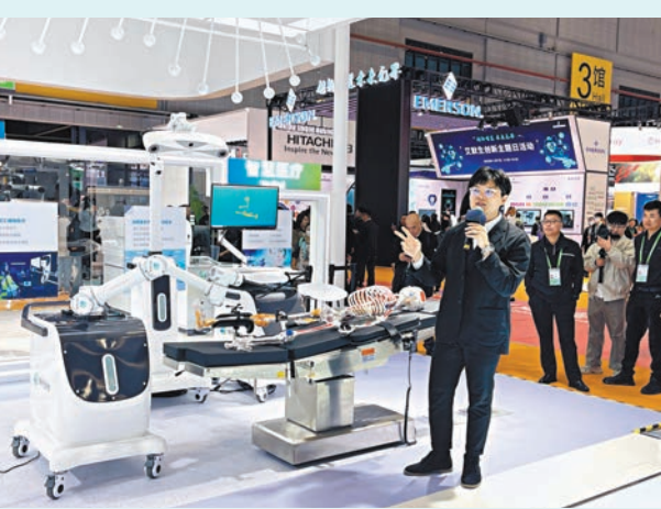
◆海克斯康的智慧醫療展示。

來自瑞典的海克斯康是知名的測量技術和信息技術提供商，本屆進博會，這家身處技術裝備展區的企業就帶來了利用自身優勢打造的運動醫學手術方面的相關解決方案。其獨立自主研發的4K超高清內窺鏡產品如同深入人體內部的一雙眼睛，助力醫生術中發現並定位微小病變並順利進行手術操作。一旁的骨科手術機器人系統更是吸睛，「醫療高精度跟蹤導航系統是骨科手術機器人系統中的核心部分，可以提高手術精度，為手術機器人提供更快響應、更高精度、更高效的跟蹤導航，為機器人系統賦予一雙『智慧雙眼』」，一邊聽着工作人員的介紹，香港文匯報記者看