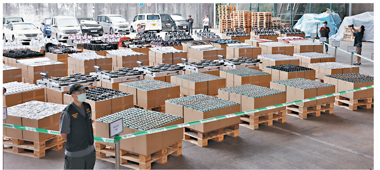
◆香港海關在行動中檢獲約7.7萬件冒牌和侵權貨物，總值超過6,700萬元。

首宗本地派遞案件，涉及青衣一間物流公司。海關在該公司內檢獲3個載有37件冒牌衣物的包裹，人員隨即聯絡收貨人，再將包裹送往黃竹坑工廈，