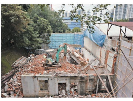
◆拆卸中的村屋地盤發生嚴重工業意外。

逐層拆，合乎規矩。勞工處及屋宇署派員到場視察，了解是否涉工序出錯或鞏固工程不足引致意外。