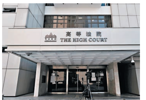
◆香港高等法院。

潘官認為原審的分析合情合理，指原審法官認為申請人在學術方面「自我膨脹、誇張失實」，是基於辯方陳詞時亦同意申請人的文章令人「摸不着頭腦」，而對申請人學術上態度「非常自豪和有不符合現實的認知與自信」，是基於本案的客觀事實和證供分析，對申請人自稱的職業及學術水平作出評估，並無任何偏見或歧視。原審在推論申請人有煽惑意圖時，亦有考慮過其他環境證供是否可作唯一合理推論。