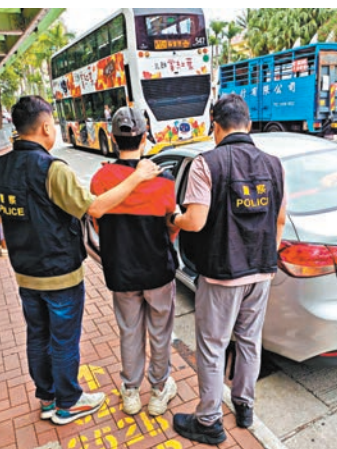
◆警方以涉嫌「非法賽車」、「危險駕駛」等罪名拘捕20名司機或車主。

健表示，專組人員根據行動中拍攝到的片段，作出深入情報收集及調查，成功鎖定涉及非法賽車的目標人物，包括是相關車輛發時的司機或車主。7日清晨時分，新界北總區交通部及刑事部人員在香港多處地方展開拘捕行動，以涉嫌「非法賽車」、「危險駕駛」及「駕駛時沒有第三者保險」等罪名拘捕20名本地男子。