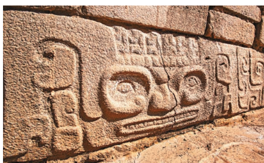
◆距今已有4,000多年的石峁遺址史前石雕。

40多座，具有明顯的等級區分，考古人員已確認這是石峁文化最高等級墓地。「今年還新發現兩處通道，將墓地和大台基區域有效連接。」孫周勇指出，這兩處通道的發現，補充了皇城台頂的道路系統，串聯起墓地與生活區，為研究揭示4,000年前石峁遺址人類活動原貌提供了更多有力證據。