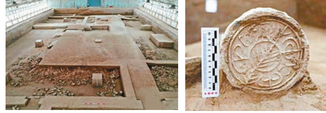
◆秦漢櫟陽城3號宮殿遺址，商鞅曾在此主持秦國變法。

記者從本屆考古學大會上獲悉，考古人員在秦漢櫟陽城遺址完整揭露了3號和11號兩座大型宮殿建築基址，這是近年來我國戰國中期都城核心建築的重要發掘。這兩座建築整體坐北朝南，呈長方形，由台基、散水等組成，第一次完