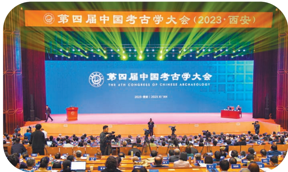
第四屆中國考古學大會日前在陝西西安舉行。

黃土高原上的史前「大道」、秦始皇帝陵罕見的6羊車、商鞅變法時的「辦公室」、中國最早的自畫像……第四屆中國考古學大會10月23日至25日在陝西西安舉行。作為中國考古學界規模最大、範圍最廣、規格最高的國際性高端學術會議，本屆大會不僅吸引了來自德國、英國、意大利、巴基斯坦、烏茲別克斯坦、蒙古國、俄羅斯、日本、韓國九個國家，以及中國內地和港台地區的800餘名考古學者參會，同時還舉辦了500多場精彩報告和公共考古講座，以主題演講和分組研討相結合的形式，發布和展示了一批中國近年來最新考古發現及研究成果。 ◆文、攝：香港文匯報記者 李陽波 西安報道