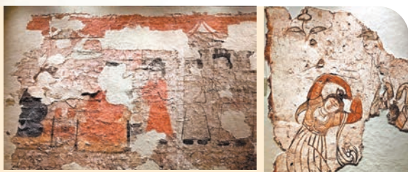
▲《邠王與郭將軍宴飲圖》

而隋唐時代壁畫是陝西古代壁畫的集大成者，此次展出的唐秋官尚書李晦墓舞女圖中，一位衣著鮮艷，頭頂雙髻，腰肢輕扭的唐代舞者正在翩翩起舞，其雙手上環，恍若現今流行的「比心」姿勢，妙趣橫生。另一位英姿颯爽的騎馬女性臉