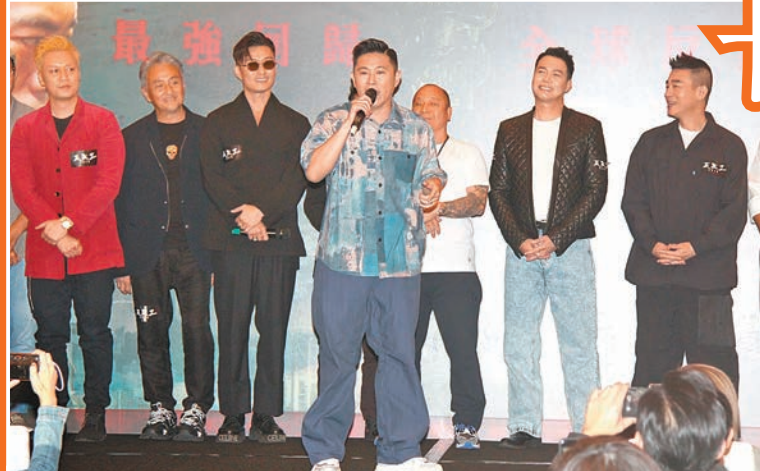
▼MC Jin透露今次演的角色喜歡「搞搞震」。