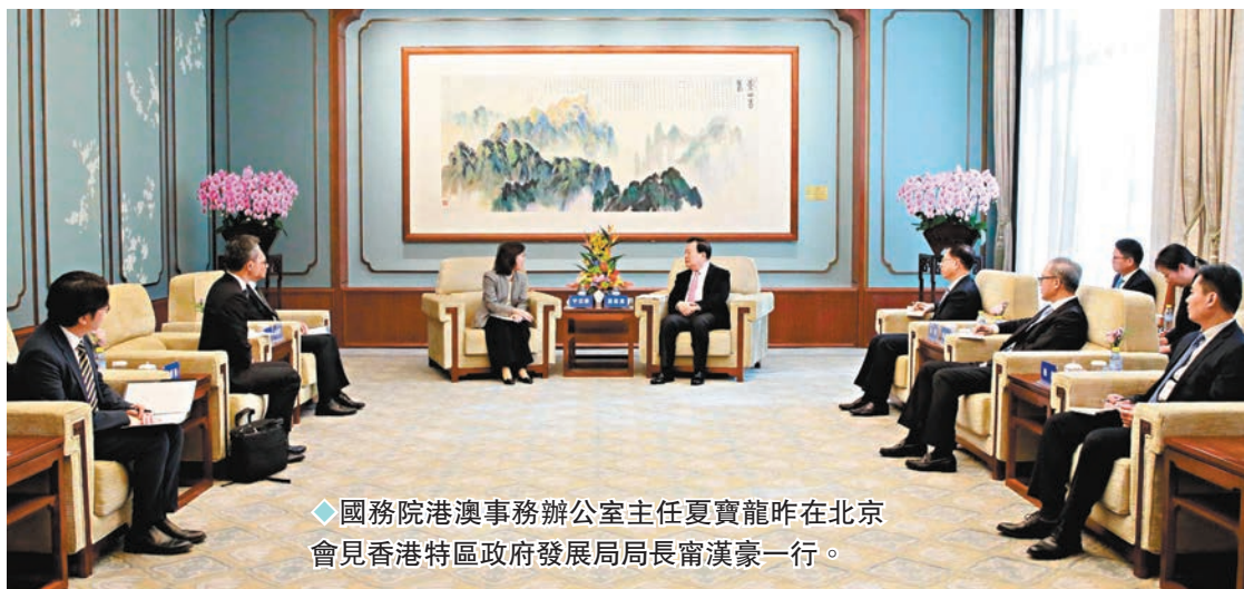
◆國務院港澳事務辦公室主任夏寶龍昨在北京會見香港特區政府發展局局長甯漢豪一行。

香港文匯報訊(記者 馬靜 北京報道)國務院港澳事務辦公室主任夏寶龍昨日上午在北京會見香港特區政府發展局局長甯漢豪一行。甯漢豪其後在總結訪京行程時引述,夏寶龍會上表達了中央肯定及支持發展局工作。是次訪京,甯漢豪還