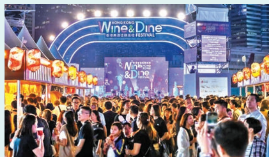
◆最近舉行的美酒佳餚巡禮,很多商戶都表示反應很好。資料圖片

通脹在第三季整體上維持溫和,基本消費物價指數在第三季按年上升1.6%,上一季上升1.7%。外出用膳及外賣的價格按年明顯上升,但升幅放緩。基本食品的價格繼續錄得輕微升幅。電力價格的升幅仍然顯著,儘管上升速度銳減,衣服價格繼續明顯上升,其他主要組成項目承受的價格壓力仍然大致可控,私人房屋租金則繼續下跌。