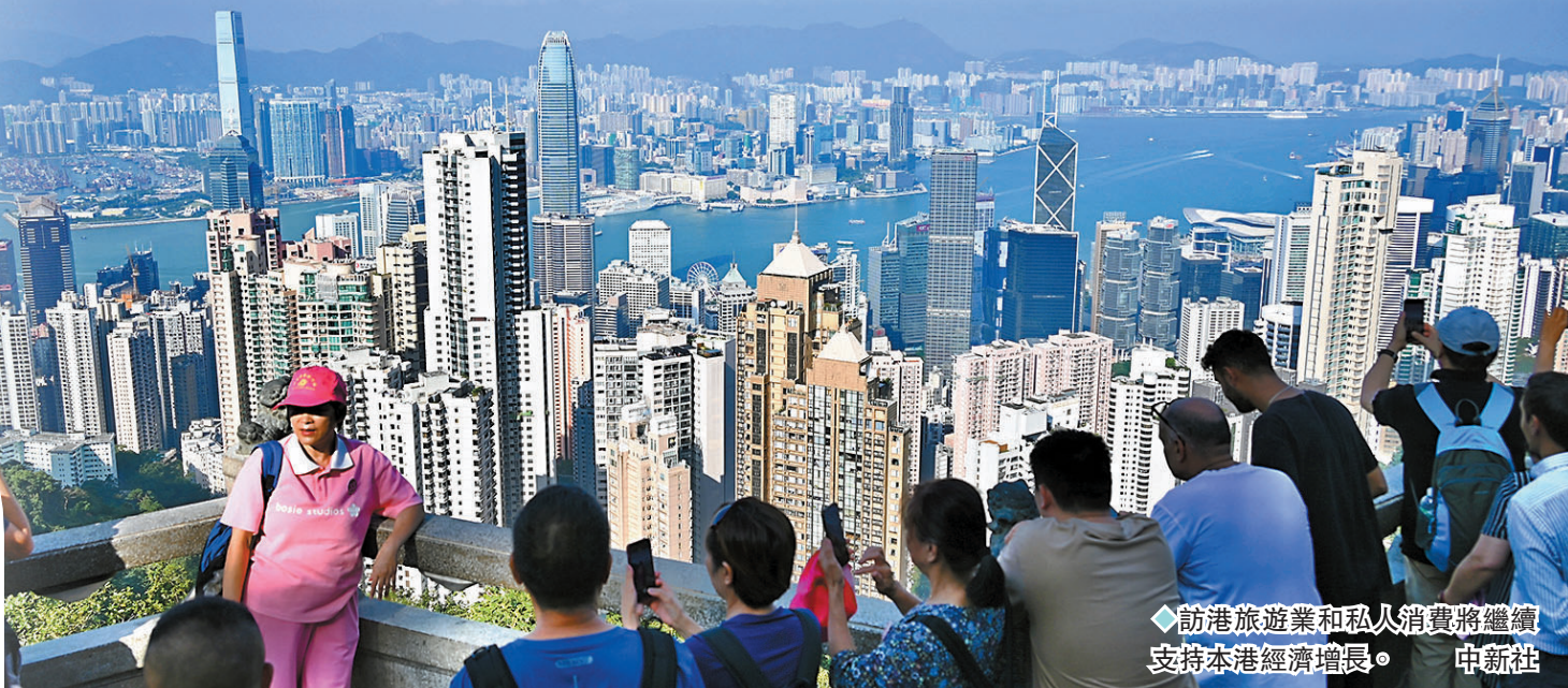
◆訪港旅遊業和私人消費將繼續支持本港經濟增長。

大新銀行經濟研究及投資策略部指出,外貿連續六個季度錄得倒退,但跌幅收窄至單位數,或反映內地及國際對香港出口需求可能正見底回穩。該行認為,預估數據顯示內需表現好壞參半,政府近日推出多項活動推動「夜經濟」及吸引旅客來港,成效有待顯現;同時資產市場表現仍然疲弱,市民短期內對消費可能會保持審慎。不過主要央行緊縮貨幣政策接近尾聲,而內地推出多項措施刺激經濟,或可推動外需逐步改善,該行預測,今年第四季經濟按年增長4.5%,全年預料增長3.2%。