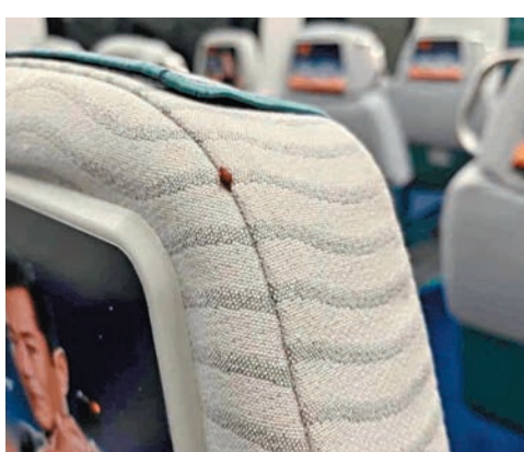
◆香港機場快線列車日前疑出現床蝨。網上圖片