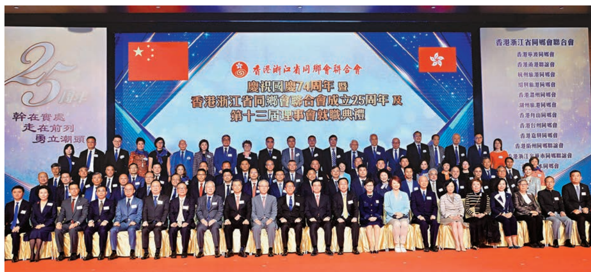
◆香港浙江省同鄉會聯合會就職典禮昨日舉行。