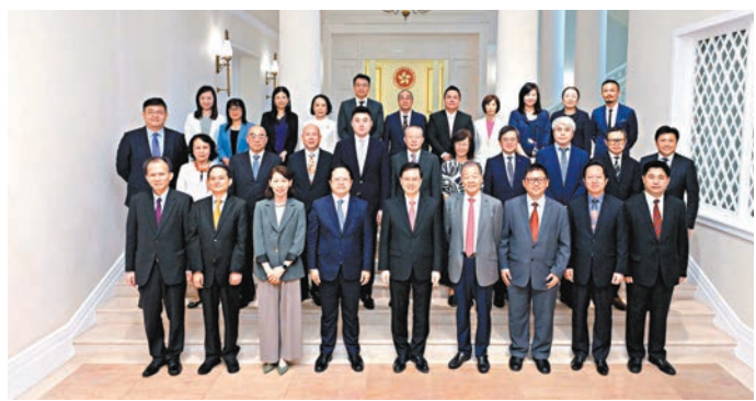
◆行政長官李家超在禮賓府會見香港新聞聯新一屆理事會成員代表並進行午餐交流。

香港文匯報訊 香港特區行政長官李家超昨日在禮賓府與香港新聞工作者聯會主席李大宏、會長張國良為首的第十一屆理事會成員代表會面並進行午餐交流。