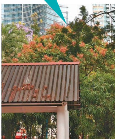
◆踏入秋冬季，複羽葉藥樹由黃色漸變成橘紅色。