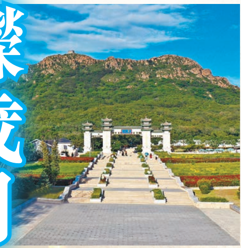
◆興城首山三峰並立，主峰頂端有烽火台。