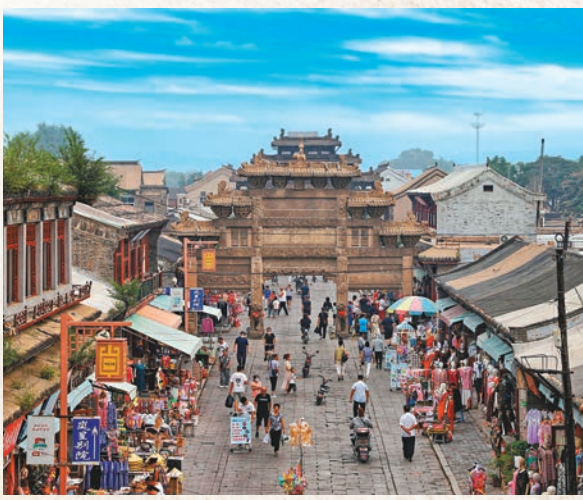
◆興城古城延輝街的繁華景象。