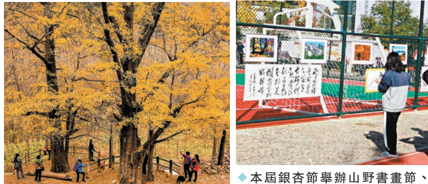
◆眾多遊客到千年古銀杏林遊玩。