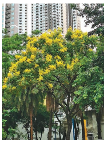
◆開花期的複羽葉藥樹，鮮黃色小花掛滿樹冠。