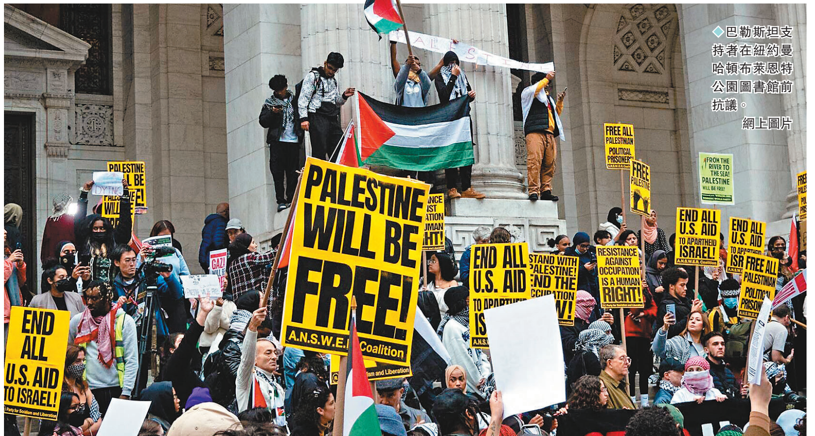
◆ 巴勒斯坦支持者在紐約曼哈頓布萊恩特公園圖書館前抗議。

路透社報道，美國政府轄下的美國國際開發署逾1,000名官員簽署公開信，敦促拜登政府呼籲以色列和哈馬斯立即停火。信中寫道「作為發展、公共衛生和人道主義援助專業人員，我們對大量違反國際法的行為感到震驚和沮喪。國際法本身是要保護平民、醫務人員和媒體人員，以及學校和醫院。」報道指這封信至今已收集1,029名職員簽名。