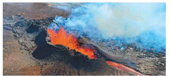
◆ 雷克雅內斯一座火山於今年7月爆發。

外的首都雷克雅未克及冰島南部沿岸大多數地區均有震感，窗戶與屋內物品出現晃動。據冰島氣象局初步數據，威力最強的地震為5.2級，震央在格林達維克北面。冰島氣象局統計自10月底以來，雷克雅內斯半島發生約2.4萬宗地震，指出地下約5公里深處有岩漿累積，若岩漿開始往地面移動，可能引發火山爆發。