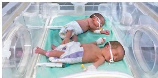
◆ 希法醫院有45名嬰兒需用保溫箱。

香港文匯報訊 加沙衛生部發言人表示，當地最大醫院希法醫院因燃料耗盡，於上週六(11月11日)停止運作，醫院內共有45名嬰兒需用保溫箱。