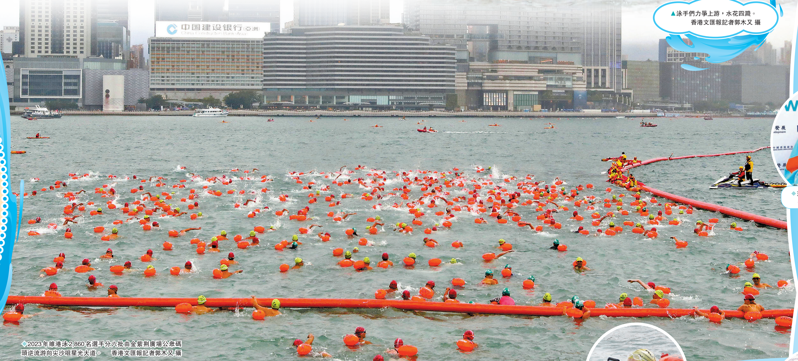
2023年維港泳2,860名選手分六批由金紫荊廣場公眾碼頭逆流游向尖沙咀星光大道。