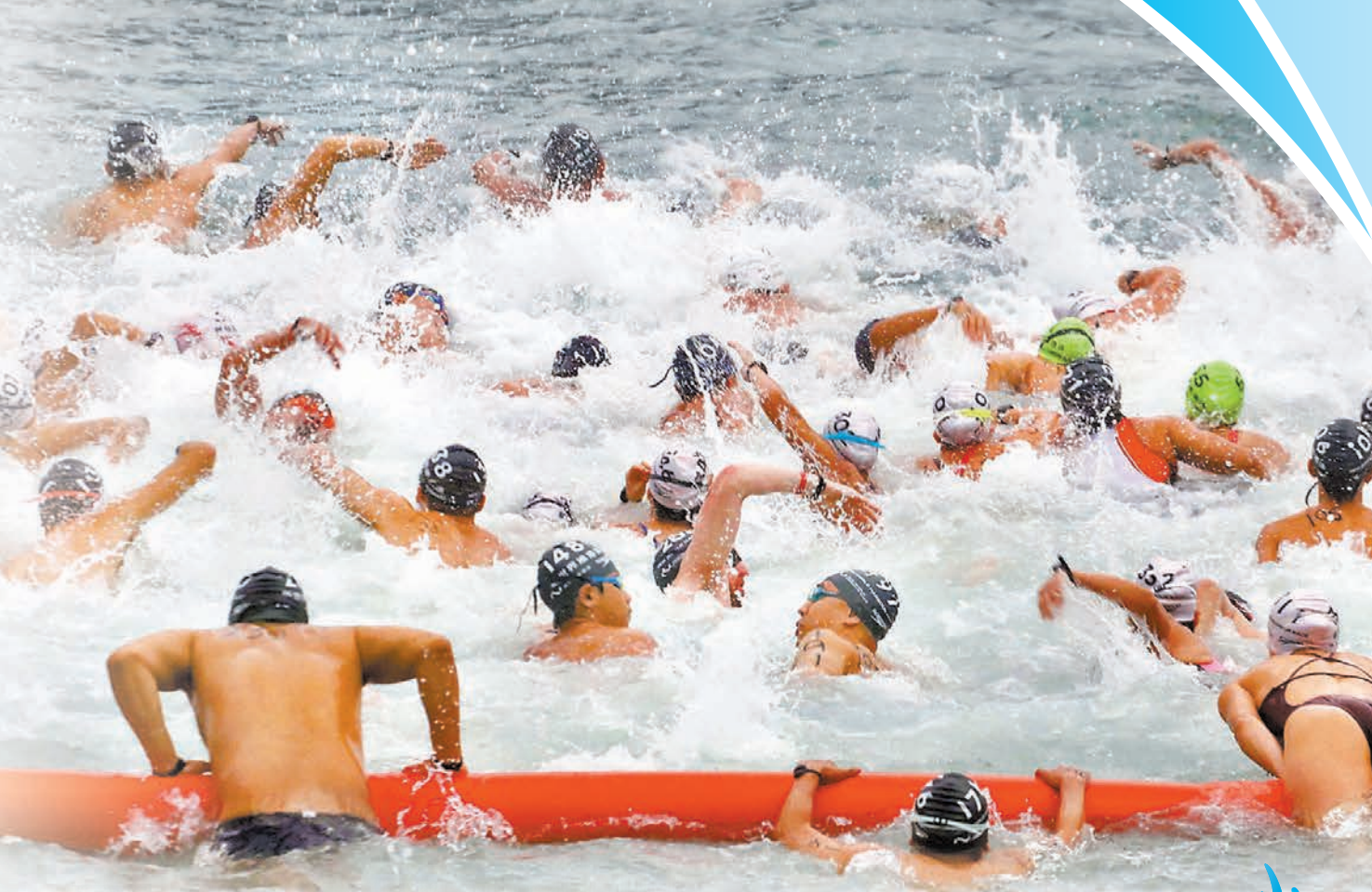
泳手們力爭上游，水花四濺。

卡」暢玩，貫徹今年活動主題——「躍在維港 海量快樂」。他表示除早上的維港泳外，昨日晚上海濱演有「香港夜繽紛」活動，是灣仔海濱舉行的「IWC 海洋嘉年華」，繼續為市民和遊客帶來繽紛活動。他亦希望這股源源不絕的活力幹勁，延續至新一屆區議會選舉，選出有才幹、有抱負、有承擔的區議員，讓新一屆區議會「躍動」起來，為美好社區注入「海量」活力。