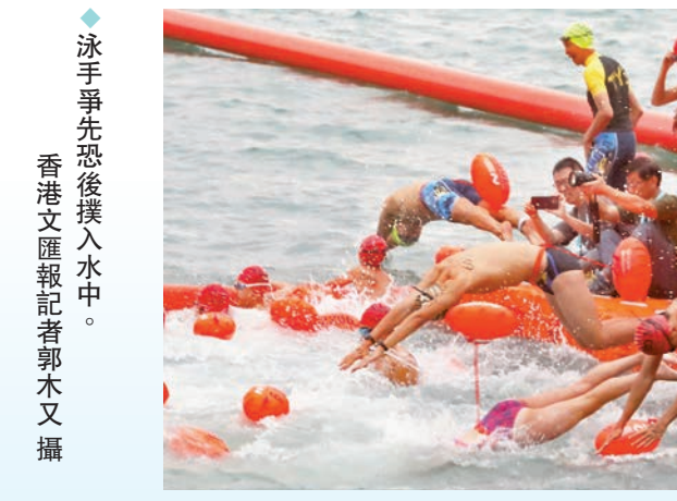
泳手爭先恐後撲入水中。

至於競賽組則重設國際組賽事，更首次有大灣區內地城市泳手參加。昨早7時30分的首場賽事為競賽組比賽，尖沙咀終點站附近當時已擠滿觀