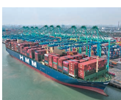
◆中美提供全球40%以上商品和服務。圖為天津港。資料圖片

美聯社周一(11月13日)形容,中美領導人今次會晤備受關注,「緩和兩國關係是雙方的一致目標」。分析認為雖然中美兩國在出口與科技管制等議題上存在分歧,但雙方都希望兩國關係能保持更大程度的穩定性。報道認為拜登政府希望管控兩國之間日益激烈的競爭,保持開放的溝通渠道,避免引發誤導導致直接衝突,中方相信會尋求美方不應發動「新冷戰」、刻意打壓中國經濟發展。