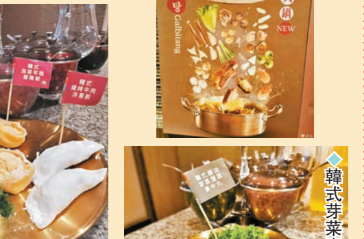
◆韓式芽菜素菜餛飩

深秋已到，又是火鍋旺季。位於灣仔道的米芝蓮星級食府美味廚每年秋冬都會推出一系列以新主題創作的火鍋菜式。今年來到第18個年頭，他們就用了韓國美食為主題來創作我們的新火鍋菜式！ 從招牌火鍋湯底韓國牛肋骨蘿蔔湯，到手工丸餃韓式燒烤牛肉洋蔥餃，韓式泡菜年糕部隊餃，韓式大醬八爪魚墨魚丸，韓式大醬紫菜海蜆豬肉丸，韓式辣醬海鮮餃，每道菜都精心融合了