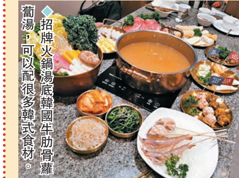
◆招牌火鍋湯底韓國牛肋骨湯，可以配很多韓式食材。