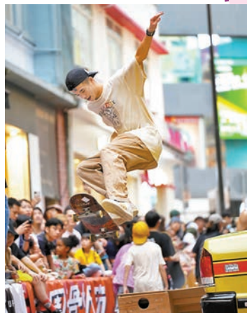
▲大會街頭滑板挑戰賽，希望把街頭文化帶進都會中心。