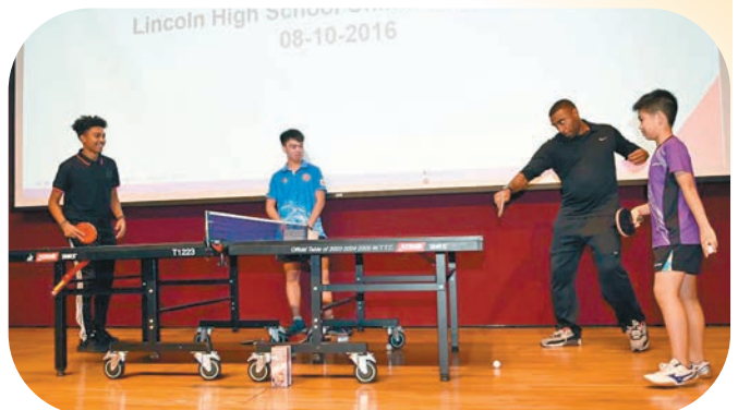
▲ 2016年10月8日，香港乒乓球運動員與美國林肯中學學生進行交流比賽。

「孩子們在中國之行中感到最興奮的事莫過於認識中國朋友，」埃爾文告訴記者，「青少年為未