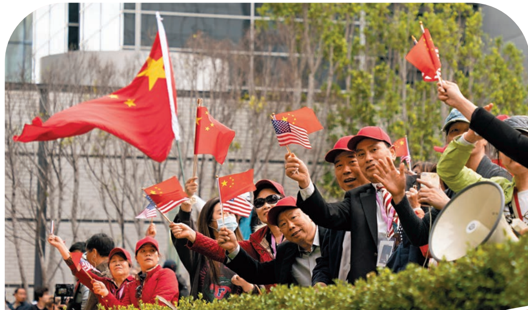
◆ 當地時間11月14日，美國華僑華人在舊金山熱烈歡迎中國國家主席習近平到訪。

這名美國學者40多年前首次到訪中國，後又長期在中國工作生活，見證了中國的飛速發展以及同亞太地區的緊密合作。他告訴記者，包括許多亞太地區國家在內的廣大發展中國家非常關注習近平主席此行，一個重要原因正是他們期待中美關係能夠穩定發展，中美兩國能攜手促進亞太地區繁榮發展。