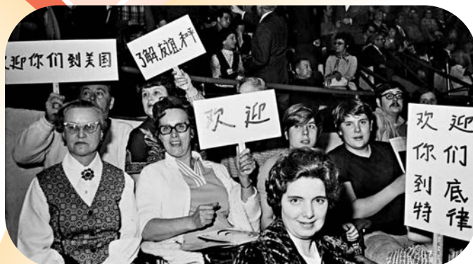
▲ 1972年4月，底特律觀眾舉着用中文書寫的標語牌，在賽場上熱情歡迎中國乒乓球代表團訪美。

在北京的中央禮品文物管理中心的展廳內，陳列着一份見證半個世紀前「乒乓外交」的禮品。