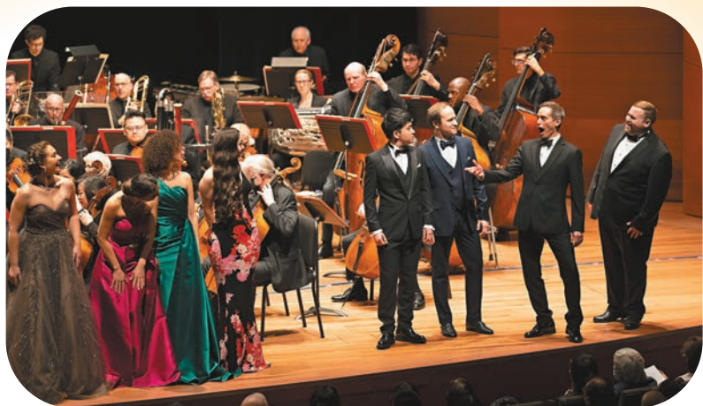
▶ 今年1月，「唐詩的回響」新春音樂會在美國上演，紀念費城交響樂團訪華50周年。 資料圖片

舊金山的形象標籤總是離不開「橋」的意象。知名地標金門大橋橫跨海灣，遊客絡繹不絕。而在過去半個世紀，一座又一座「橋樑」跨越大洋，連接中美。