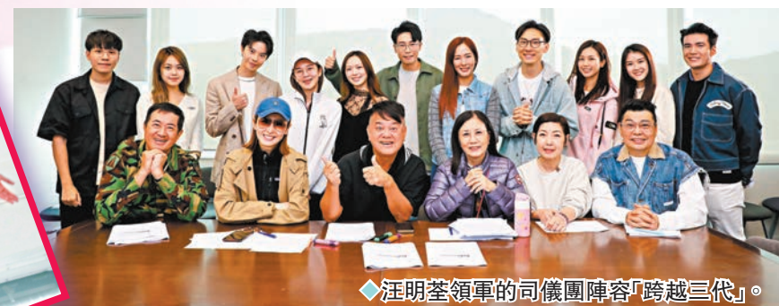
汪明荃領軍的司儀團陣容「跨越三代」。