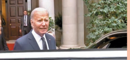
▲拜登指著習近平的元首座駕好漂亮。