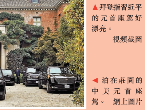
▲泊在莊園的中美元首座駕。