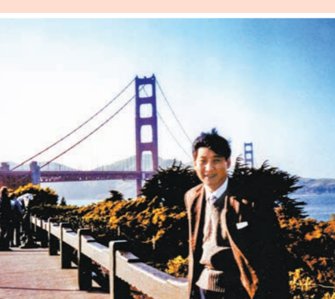
▲拜登將自己手機上展示1985年習近平在擔任正定縣委書記時訪問舊金山的一張照片。

「你認識這個年輕人嗎？」莊園宴會廳裏，燈光璀璨，裝飾典雅。當中國國家主席習近平走來時，在宴會廳門口迎接的美國總統拜登舉起自己手機，指着一張照片笑問道：「認識啊，這是我38年前。」習近平說。拜登在手機上展示的是1985年習近平到訪舊金山時的一張照片。38年前，時任河北正定縣委書記的習近平首次訪問美國，抵達的第一站就是舊金山。