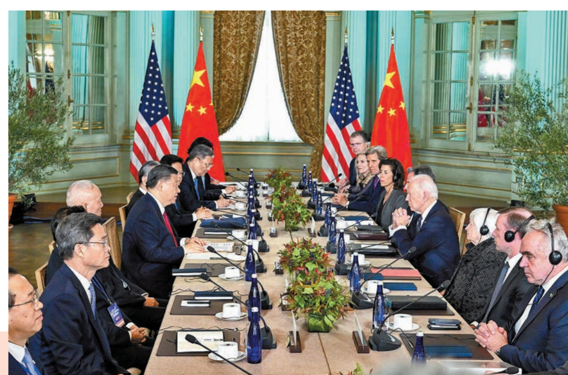
▲當地時間11月15日，習近平同美國總統拜登在斐洛里莊園舉行中美元首會晤。

台灣問題始終是中美關係中最重要、最敏感的問題。習近平主席詳細闡明了中方的原則立場。他指出，中方重視美方在巴厘島會晤中作出的有關積極表態。美方應該將不支持「台灣」的表態體現在具體行動上，停止武裝台灣，支持中國和平統一。中國將統一，也必然統一。