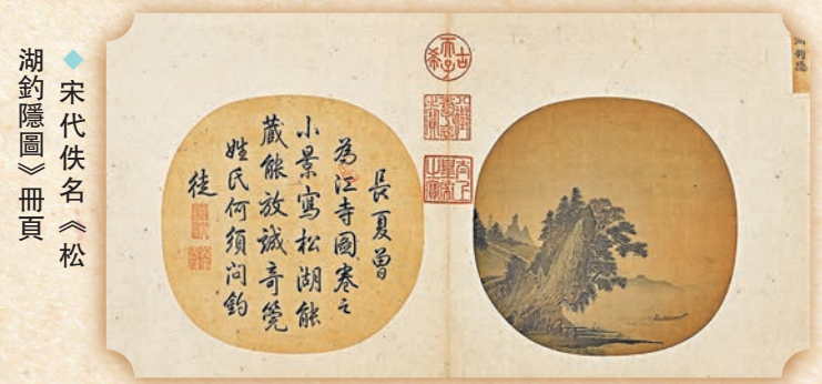
◆宋代佚名《松湖釣隱圖》冊頁