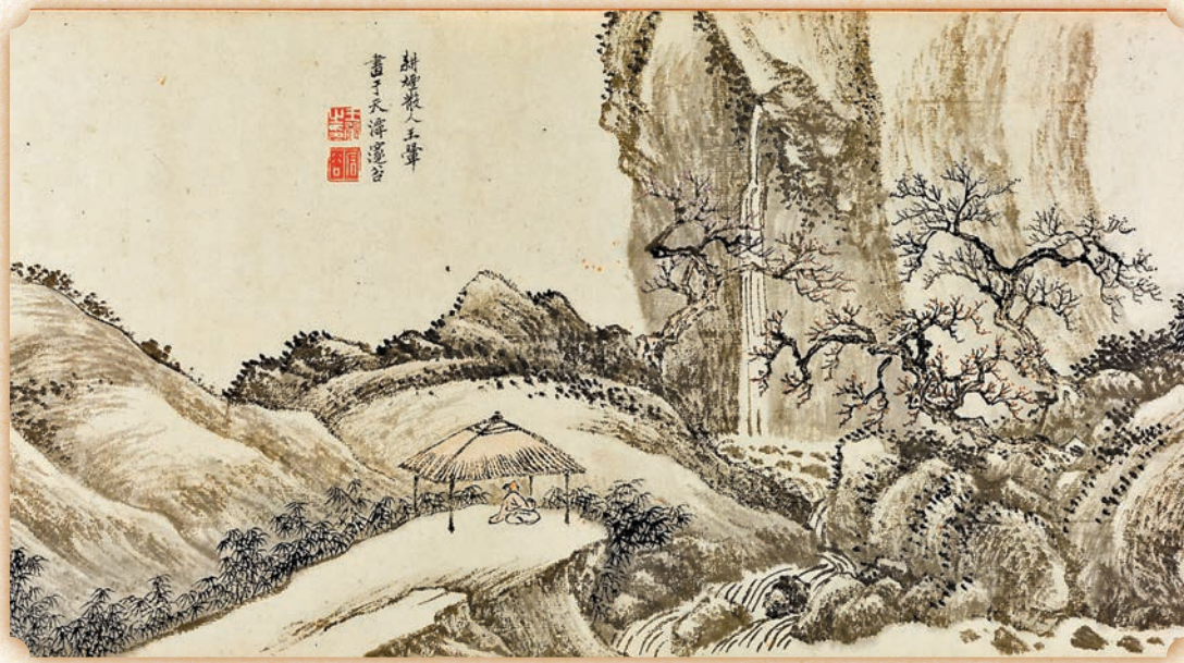
◆清代王翬《觀梅圖》(局部)

中國古代山水畫是再現客觀自然和表現主觀精神相結合的繪畫藝術，即「外師造化，中得心源」。各個時代、各個地域的畫家們在山水間味象、暢神，繼而解衣盤礴，以不同的筆墨呈現胸中丘壑，如百川歸海，最終匯成蔚為壯觀的山水畫藝術。