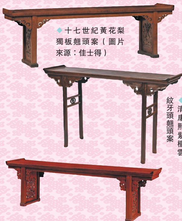
◆十七世紀黃花梨獨板翹頭案

宋至明早期家具的慕古之作，卻又在牙頭加入了當時流行的雲紋元素為裝飾，腿足選用圓材，足間雙圓材梯枨中嵌入雙套環卡子花，整體風格更為清麗簡約。