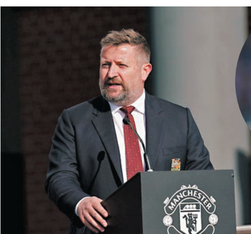
阿諾去年2月才接任曼聯CEO一職。