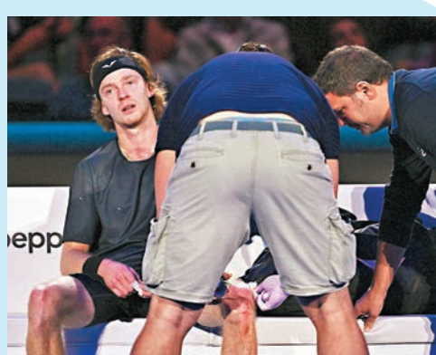
盧布列夫一度情緒激動，用球拍大力拍打自己膝頭致受傷。