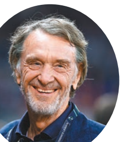
拉傑夫入股曼聯快將成事。