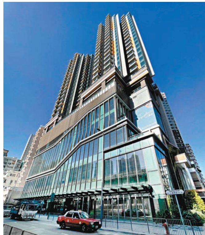
◆市建局協助建立的深水埗設計及時裝基地已竣工，上月交付予香港設計中心營運。