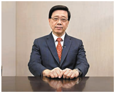
▲「2023粵港澳大灣區企業家論壇」昨日在深圳舉行。李家超透過視像致辭表示，大灣區前景光明，機遇處處。 視頻截圖