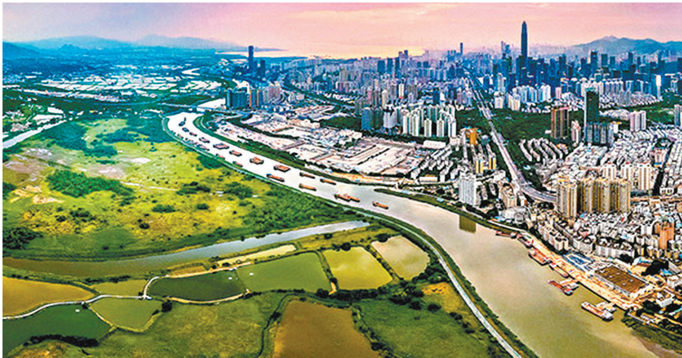
▶李家超表示有信心深港兩地將善用合作區「一河兩岸」下「一區兩園」的優勢。圖為河套地區。

「今年4月，習近平主席在廣東考察時指出，大灣區在全國新發展格局中具有重要戰略地位，要使大灣區成為新發展格局的戰略支點、高質量發展的示範地、中國式現代化的引領地。」李家超表示，當前，世界正處於百年未有之大變局。地緣政治衝突不斷、單邊保護主義嚴重、經濟下行壓力增加。本次論壇聚集粵港澳大灣區的專家學者，共同商討大灣區的企業家如何應對國際變局帶來的挑戰，並把握大灣區獨特的發展機遇。