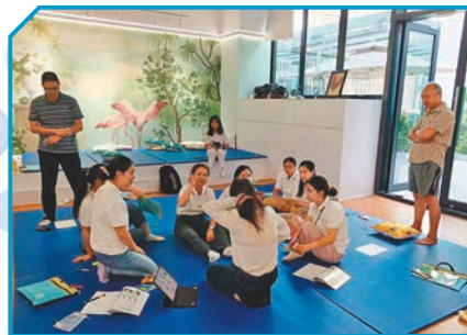
◆入駐 Bayswork 的從事健康管理港企員工進行互動訓練。