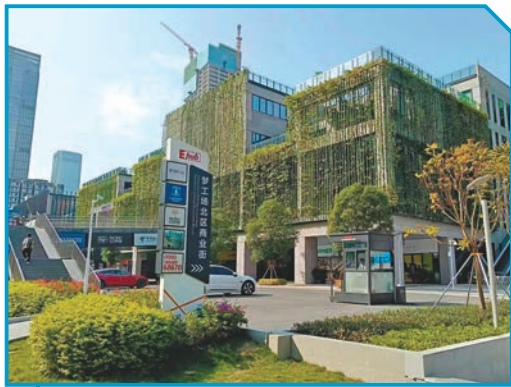
◆綠蔭覆蓋的前海深圳青年夢工場北區。