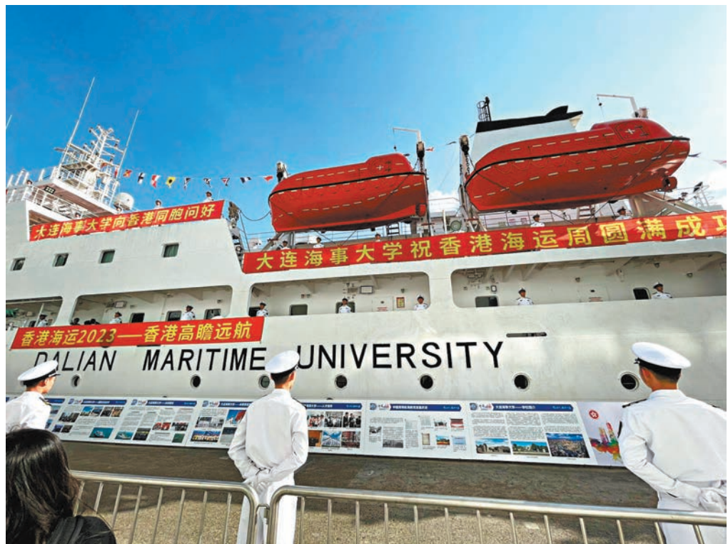
◆「育鯤」輪繼2017年後再次訪港，由今日起一連6天開放參觀。香港文匯報記者張弦 攝

香港文匯報訊（記者 張弦）「香港海運周2023」近日舉行，為增強香港與內地航運界的交流與合作，內地第一艘自行開發設計的航海教學實習輪船「育鯤」輪，繼2017年後再次訪港，由今日起一連6天開放予香港市民及對海運有興趣的學生參觀。今年8月在「育鯤」輪實習的香港學生形容到該船實習是難得機會，可了解是否適合從事相關工作，且獲得經驗之餘，還與內地學生結下情誼，並見到香港難得一見的星空和燦光海。