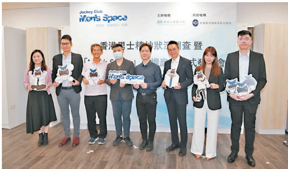
◆調查顯示，超過三成受訪男士會出現中度或嚴重的精神健康風險。

心理衛生會指出，男士受限於刻板印象以及服務宣傳不足，因此沒有足夠的動力及知識去尋找協助，往往會在情況惡化至無法收拾的地步才求助，而賽馬會「再闖男天」計劃開始至今，共有49宗個人輔導個案，當中有12%的求助個案表