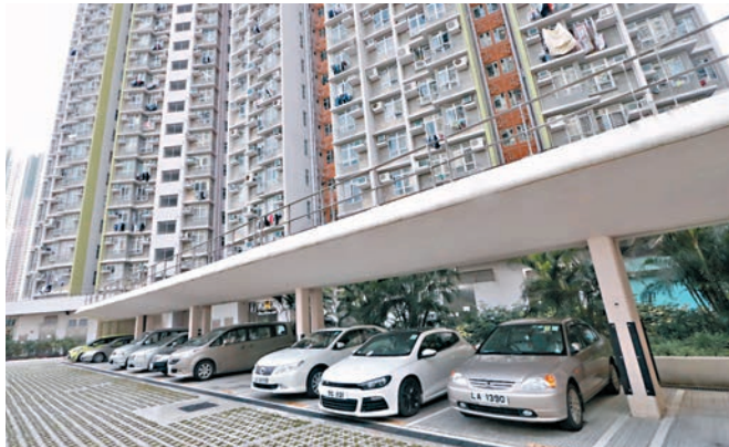
◆明年1月1日起，房委會轄下停車場將上調收費。圖為房委會轄下停車場。

香港文匯報訊 房委會商業樓宇小組委員會昨日通過由明年1月1日起，輕微上調房委會轄下停車場收費。私家車和輕型貨車露天及有蓋泊車位的月租收費分別上調120元及140元；大型巴士露天及有蓋泊車位月租收費分別上調160元及180元；電單車露天及有蓋泊車位月租收費則分別上調30元及40元。