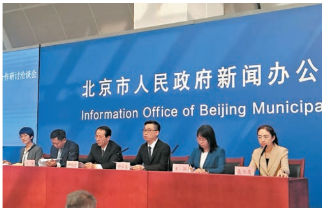
◆第26屆北京·香港經濟合作研討會新聞發布會現場。

積金局強調，強積金制度提供不同市場及資產類別的基金，各有不同的投資目標和風險程度，讓成員建立多元化的投資組合，以分散投資風險。積金局經常提醒計劃成員須因應自己的人生階段、投資目標和風險承受能力等因素，揀選適合自己的強積金投資組合。