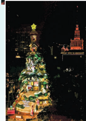
▲靜安嘉里中心20米高的冬季主裝置被點亮。