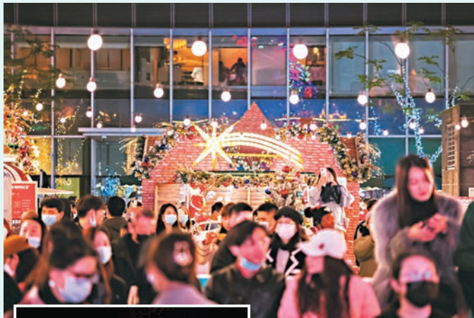
▲夢幻薑餅鎮冬夜市集即將啟動。

據悉，從下個月的周末起，節日限定夜間市集也將在冬季回歸。今年的夜市將以薑餅小鎮為視覺靈感，帶來場景感與互動性十足的特別體驗，匯聚包括風味小吃、甜品、首飾、香薰等來自海內外的品牌限定攤位。期間還將開放靜安嘉里中心JAKC獨家定製薑餅派送、冬季變裝體驗、「節日使者」限時遊場送禮等互動體驗，還推出零售和餐飲現金禮券。