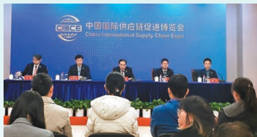
◆21日，中國貿促會召開首屆中國國際供應鏈促進博覽會籌備情況新聞發布會。

與此同時，歐洲、日本和東亞地區的參展企業也在不斷增加，有些企業已提前預訂第二屆鏈博會展位。首屆鏈博會還將設立國際展區，南非、加拿大、日本、越南、非盟國家、葡語國家、拉美和加勒比國家等將以國