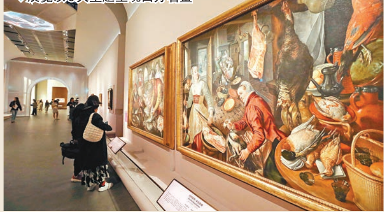
◆展覽以6大主題呈現西方名畫。

赴港的英國國家美術館館長加布理埃爾·芬納迪表示，在早前的上海站和首爾站巡迴展，展覽方式是按時間順序排列，今次在香港的展覽則是按不同主題排列，是非常有魅力和有趣的展示方式。「我們很高興之前的展覽吸引了大批觀眾入場，也期待能將這批珍藏介紹給廣大香港觀眾。」