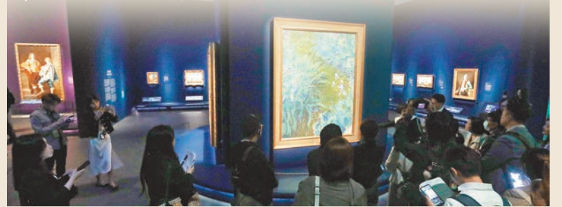
◆展覽料吸引30萬人次入場。