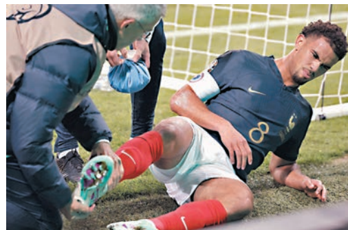
薩爾尼艾馬利要休養兩個月。