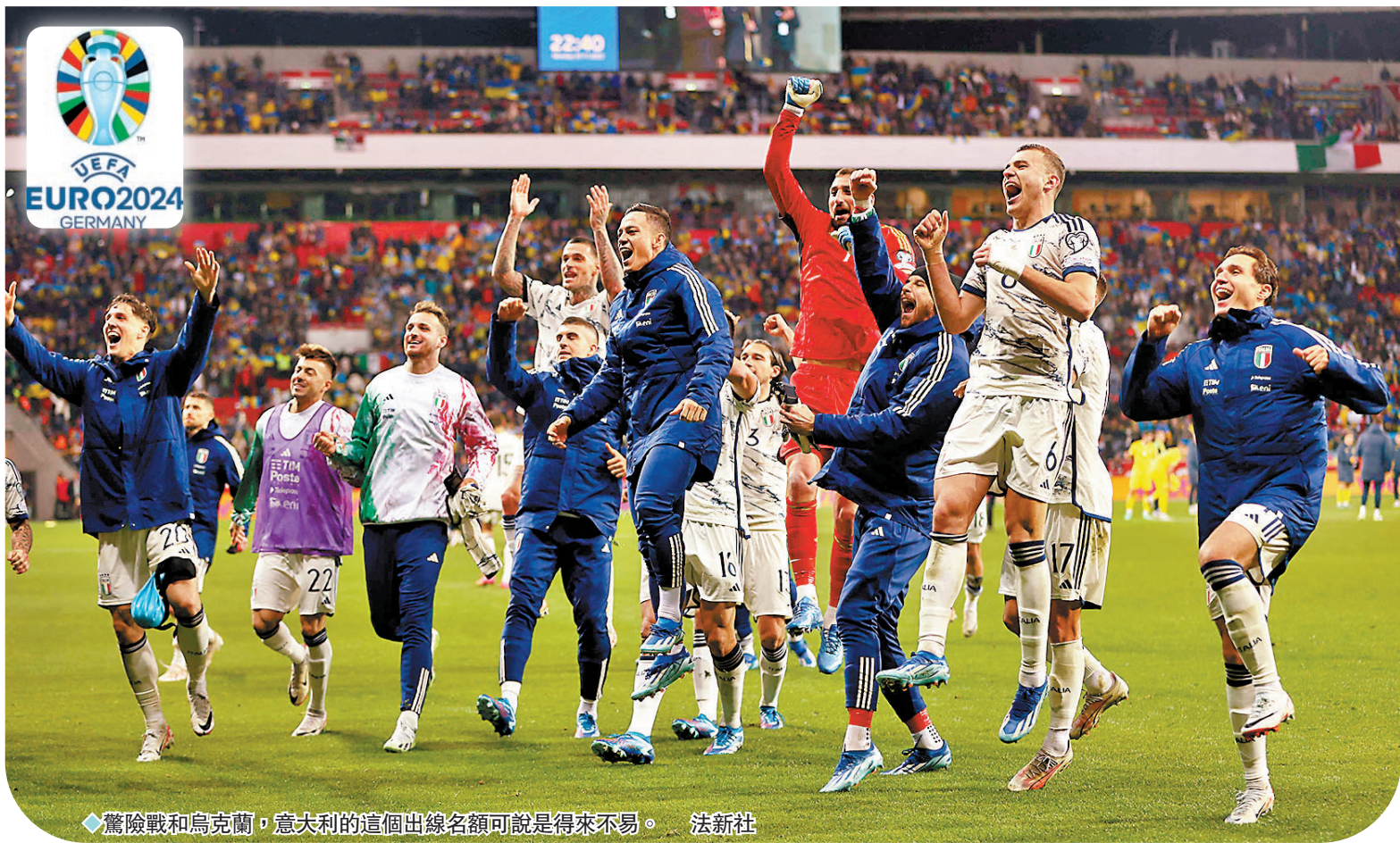
驚險戰和烏克蘭，意大利的這個出線名額可說是得來不易。

在本港時間21日凌晨歐洲國家盃外圍賽（歐國外）C組壓軸大戰，衛冕冠軍意大利在德國中立場成功戰和烏克蘭0：0，驚險取下小組次名的出線資格，免於陷入又要再踢附加賽的尷尬境地。不過，就在比賽補時階段，意軍球員在禁區內有犯規嫌疑，VAR（視像球證）卻沒有介入覆核，球證亦決定不判12碼，加上歐洲足協主席施費連日前一番話，引來部分球迷熱議，質疑「藍衣兵團」是否有獲保送入歐國盃之嫌。