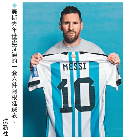
美斯去年世盃穿過的一套六件阿根廷球衣。