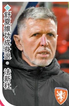
舒夏維維功成身退。

舒夏維維解釋：「儘管現在很高興，但我們（我和足總）賽前就已經決定不再繼續了。」今年62歲的舒夏維維曾經是後防球員，上月捷克以0：3輸給阿爾巴尼亞後導致晉級出現險象，加上球隊整體戰績不佳，已遭捷克足總縮短合約至11月30日，取得歐國盃出線資格後才可選擇再延長。捷克隊也因上周的醜聞而更添壓力，韋斯咸後衛高法爾和另外兩名球員在國際賽期間「蒲夜店」而被逐出大軍名單，「壓力是巨大的，有時難以理解，這是我們作出（終止合作）決定的因素之一。」舒夏維維說。