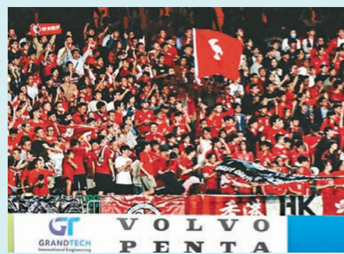
◆大量港足球迷入場打氣。