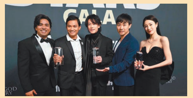
◆林夏薇與日本男星佐藤健、泰國男星Tony Jaa等同台獲獎。