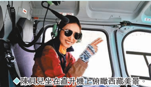
◆陳貝兒坐在直升機上俯瞰西藏美景。