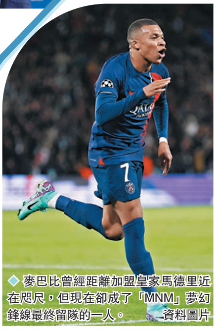
◆ 麥巴比曾經距離加盟皇家馬德里近在咫尺，但現在卻成了「MNM」夢幻鋒線最終留隊的一人。資料圖片

巴黎聖日耳門(PSG)自從2011年卡塔爾石油資本入主後，成為歐洲足壇金元足球一股雄厚勢力，現時足壇最高轉會費的世界紀錄，前兩人都是由這家法甲豪門球會所創，過去兩年更曾經打造過美斯、尼馬、麥巴比的「MNM」夢幻鋒線。不過，隨着今年夏季美斯和尼馬離隊，PSG也尋求發展新方向，招攬了不少年輕新秀，放眼未來的同時，亦為麥巴比去留作好準備。