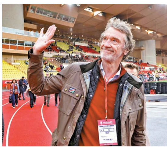
◆ 拉傑夫也是法甲球會尼斯的班主。資料圖片

如果兩支球隊在各自聯賽中排名相同，那麼會根據所屬聯賽在歐洲足協的排名，而由於英格蘭聯賽排第1，屆時曼聯拿到歐聯資格後將可出賽。曼聯和尼斯下賽