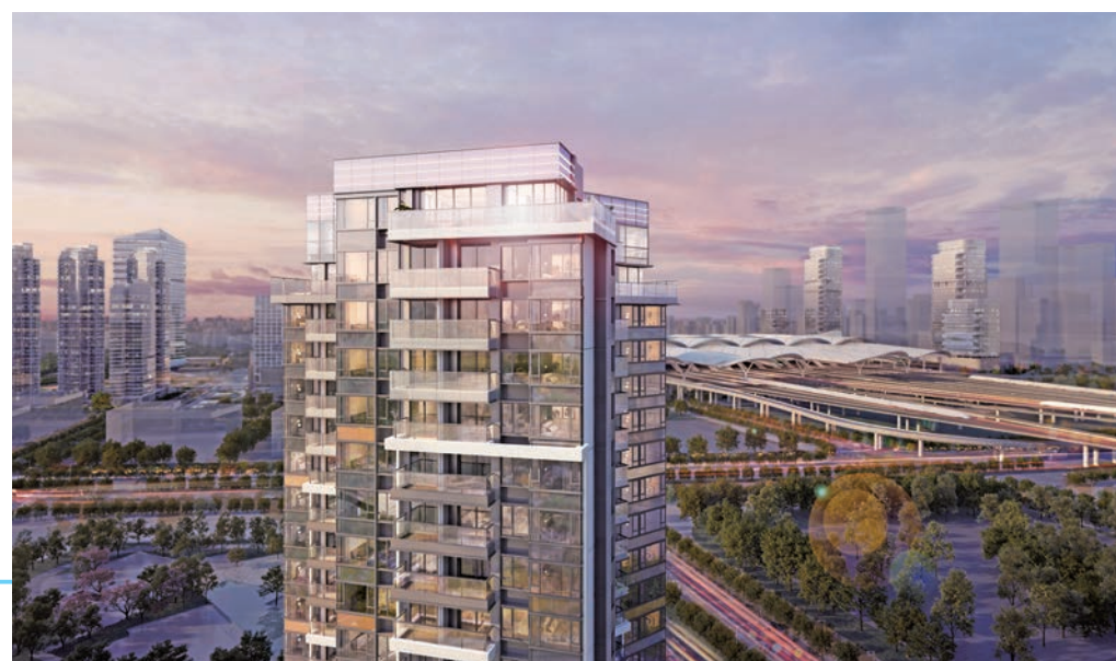
◆ 廣州南站 ICC·峻鑾 Forest Park 距離廣州南站僅約 400 米，為南站核心區內罕有的低密度純住宅項目。峻鑾佔地約 75 萬平方呎，由 14 幢低密度住宅組成，提供約 1,300 個單位，戶型多元化。

廣州南站 ICC 是新地正在大灣區發展的大型地標物業，總樓面面積約 930 萬平方呎。項目與廣州南站無縫連接，該站匯聚 12 條高鐵、城際鐵路和地鐵線。廣州南站 ICC 盡享大灣區「一小時生活圈」的交通便利，並與集團在香港的物業特別是高鐵西九龍總站發展項目發揮協同效應，預期項目將成為大灣區內集商業、生活和完善交通網絡於一體的新樞紐。早前項目踏入新里程，其住宅部分廣州南站 ICC·峻鑾 Forest Park 已展開銷售工作，並設有現樓銷售中心及示範單位。此外，與廣州南站僅一個高鐵站之隔的慶盛站，新地亦正在發展一個 TOD 綜合項目，預計項目有助促進南沙發展為大灣區內重要的交通樞紐和科研及創科中心。