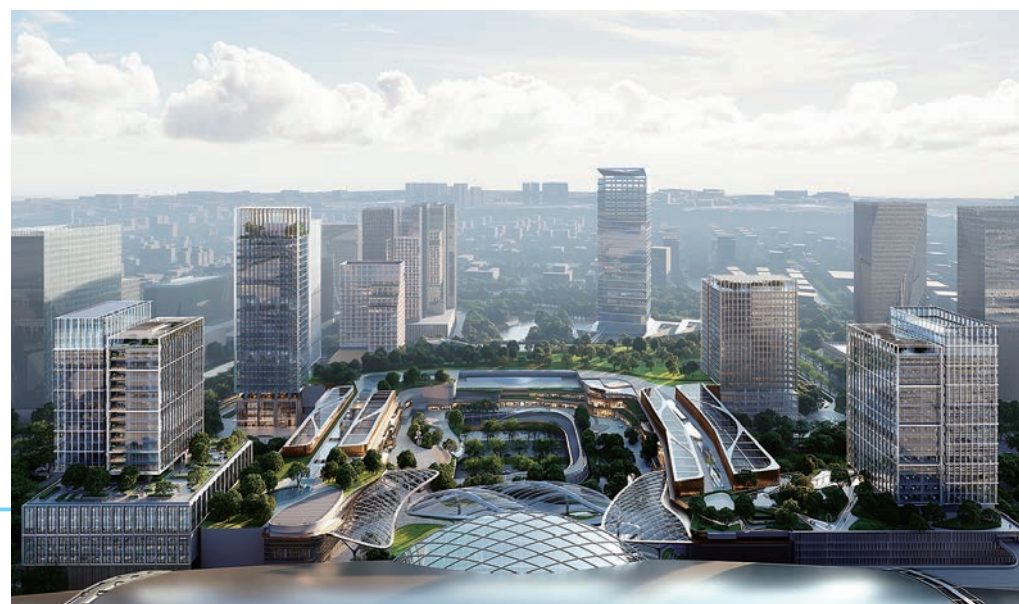
◆ 左圖為廣州南站 ICC 的效果圖。新地期望廣州南站 ICC 可發揮南站交通便利及客流匯集的先天優勢，發展成優質的大型綜合 TOD 項目，吸引人才、企業和資源，協助該站升級為「站城一體、無縫銜接、業態融合」的大灣區門戶樞紐。

正在興建的高鐵西九龍總站發展項目和西九文化區藝術廣場大樓項目預計在 2026 年全面落成，將與新地已落成的 ICC 組成獨特的商業樞紐，提供逾 570 萬平方呎優質甲級寫字樓樓面；該寫字樓建築群連同集團在區內的兩間豪華酒店和其他零售樓面，將推動西九龍成為發展成熟的文化商業中心區，匯聚豐富的商業、零售和娛樂選項。以上項目均享有極為完善的交通連接，可經高鐵暢達大灣區。