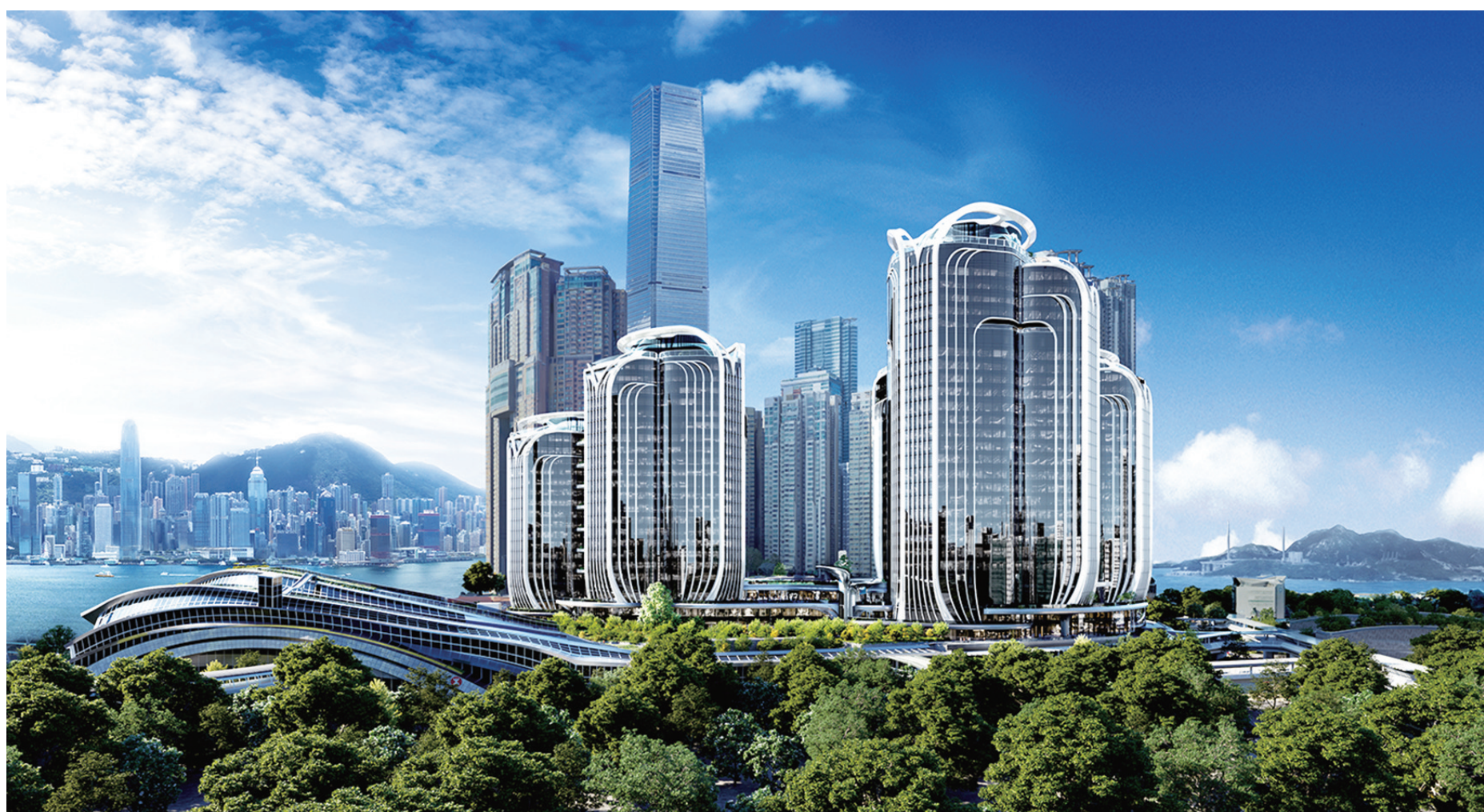
◆ 以上為新地高鐵西九龍總站發展項目的效果圖。該項目連同鄰近的環球貿易廣場，及正在興建的西九文化區藝術廣場大樓，將推動該區以至香港成為大灣區重要的商業、零售、文化及交通樞紐。

新鴻基地產（以下簡稱「新地」）一直秉持「以心建家」的信念，在香港和內地發展優質的住宅和商業項目。新地正在發展的大灣區重點項目包括高鐵西九龍總站發展項目和廣州環球貿易廣場（廣州南站 ICC），兩個項目均位置優越，會以公共交通導向模式（transit-oriented development 或簡稱 TOD）發展，將與新地西九龍的現有物業香港環球貿易廣場（ICC）聯同位於西九文化區的藝術廣場大樓項目產生協同效應，配合「軌道上的大灣區」的發展步伐，促進粵港兩地的交流合作，吸引不同地區、不同類型的人才聚集，滿足大灣區人民不同的辦公、消費及居住等需求。