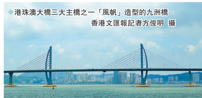
◆港珠澳大橋三大主橋之一「風帆」造型的九洲橋。