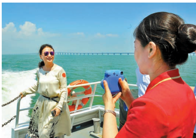
◆在港珠澳大橋旅遊試運營之前，遊客通過坐船海上遊覽大橋。