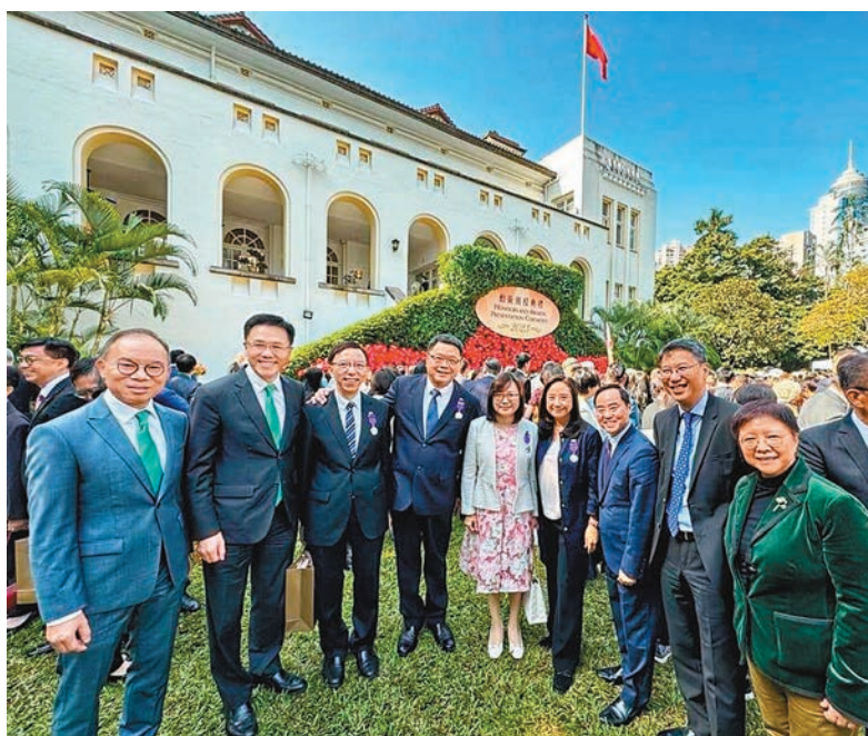
◆一章參與典禮人士於禮賓府合照留念。