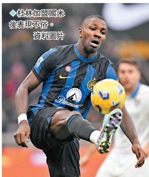
◆杜林加盟國米後表現不俗。資料圖片

香港文匯報訊(記者 楊浩然) 意甲於香港時間周一凌晨上演「意大利國家打吡」兼榜首大戰，由「二哥」祖雲達斯主場對戰排第1名的國際米蘭，衡量後主場出擊的「祖記」值得看高一線。(now638台周一3:45a.m.直播)