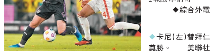
◆卡尼(左)替拜仁奠勝。

德甲班霸拜仁慕尼黑於香港時間周五凌晨聯賽提早登場，結果球隊憑哈卡尼的入球，作客以1:0擊敗科隆，而入球的卡尼(18球)更打破查頓辛祖(17球)紀錄，成為德甲單季入球最多的英格蘭球員。另一方面，巴黎聖日耳門則於法甲主場5:2戰勝摩納哥。