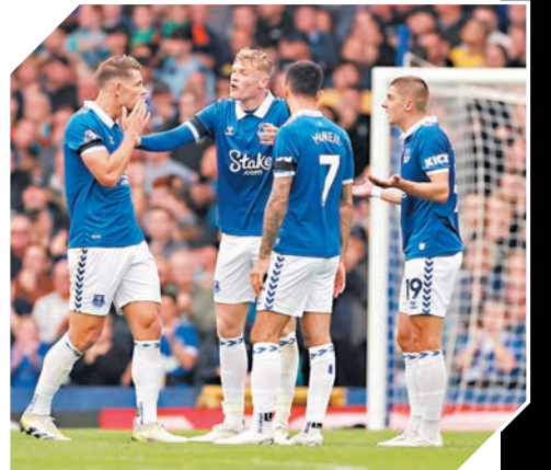
◆愛華頓球員均希望助球隊渡過難關。

普斯迪高路賽前表示，希望憑主場威力爭勝：「維拉在艾馬利帶領下表現出色，踢法十分一致且攻擊力強橫，加上傷停問題對我們肯定是更大考驗；幸而球隊今季主場表現特別出色，希望屆時我們可憑主場氣勢爭勝。」